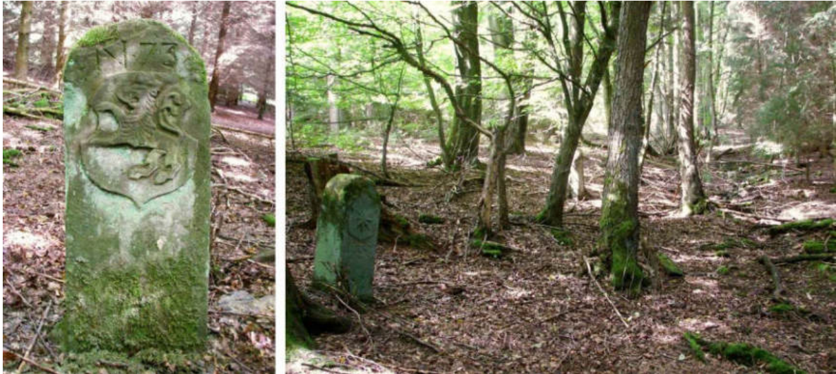
Abb. 94: Grenzstein Nr. 73 (1739) – Ansicht der H-Seite, Standort (von O zu Nr. 74) Auf Nr. 72 folgt rd. 90 m westlich und etwas höher der gut erhaltene Grenzstein Nr. 74 (1739).