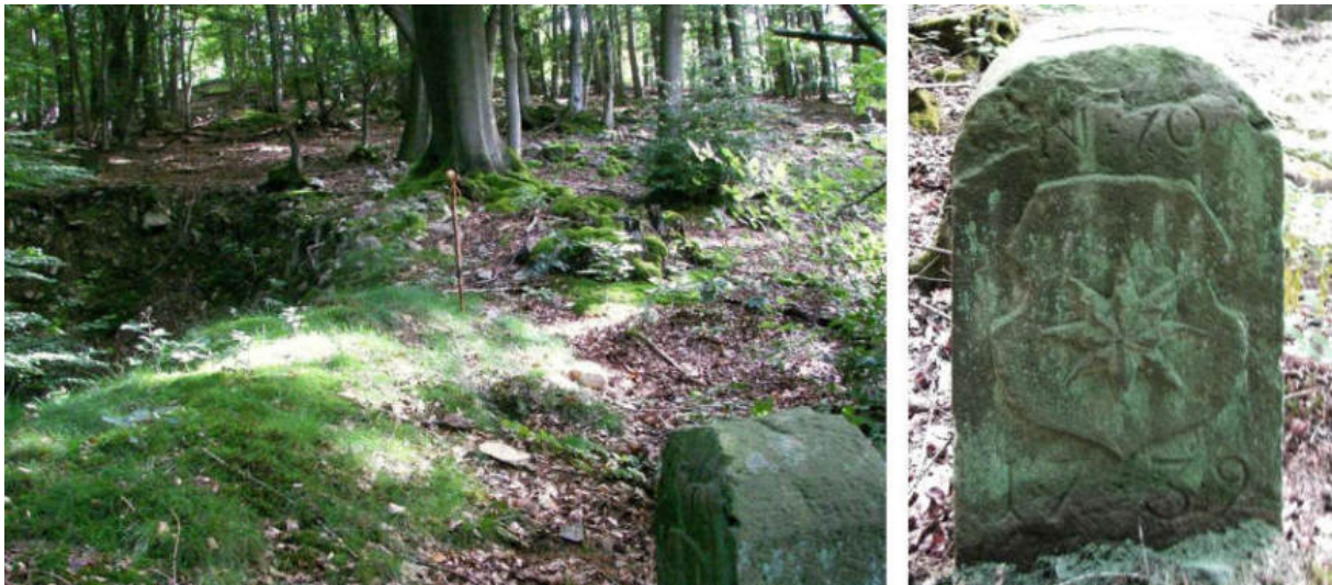
Abb. 90: Grenzstein Nr. 70 (1739) – Standort (von SW), Ansicht der W-Seite

Von Grenzstein Nr. 69 auf dem Söhlen-Kopf geht es in südwestliche Richtung 90 m bergab zu Stein Nr. 70 auf einem Sandsteinrücken in ehemaligem Steinbruchgelände.