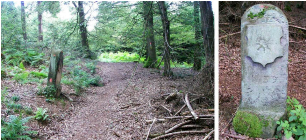
Abb. 69: Grenzstein Nr. 52 (1739) – Standort (von N), Ansicht der W-Seite