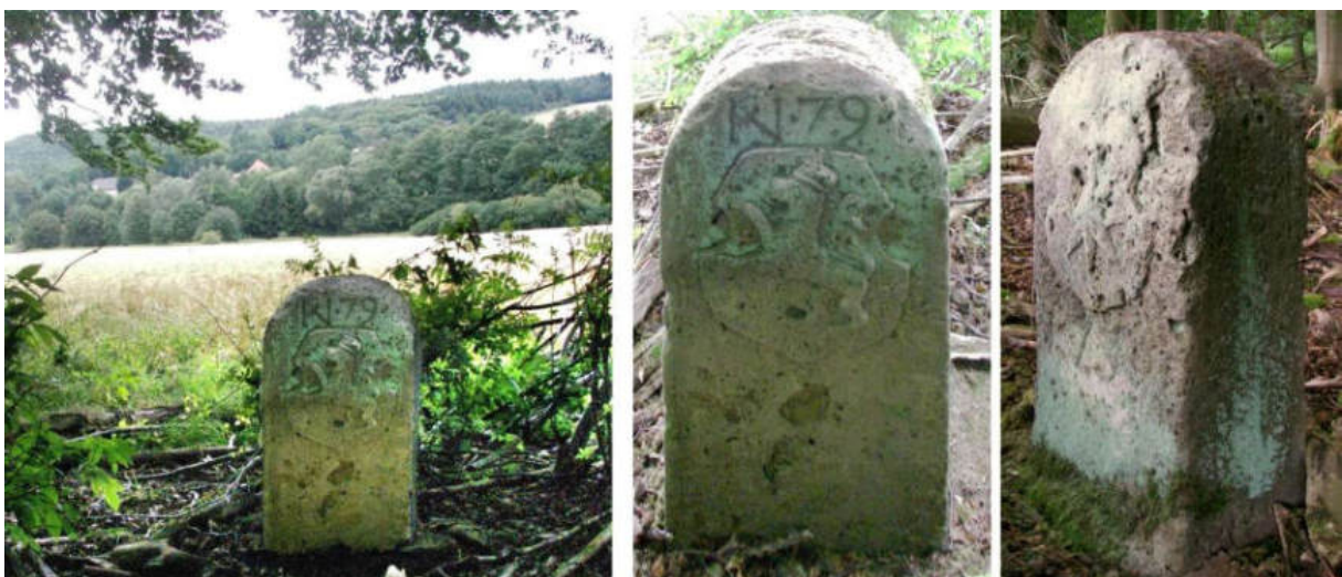
Abb. 102: Grenzstein Nr. 79 (1739) – Standort (von S), Seitenansichten