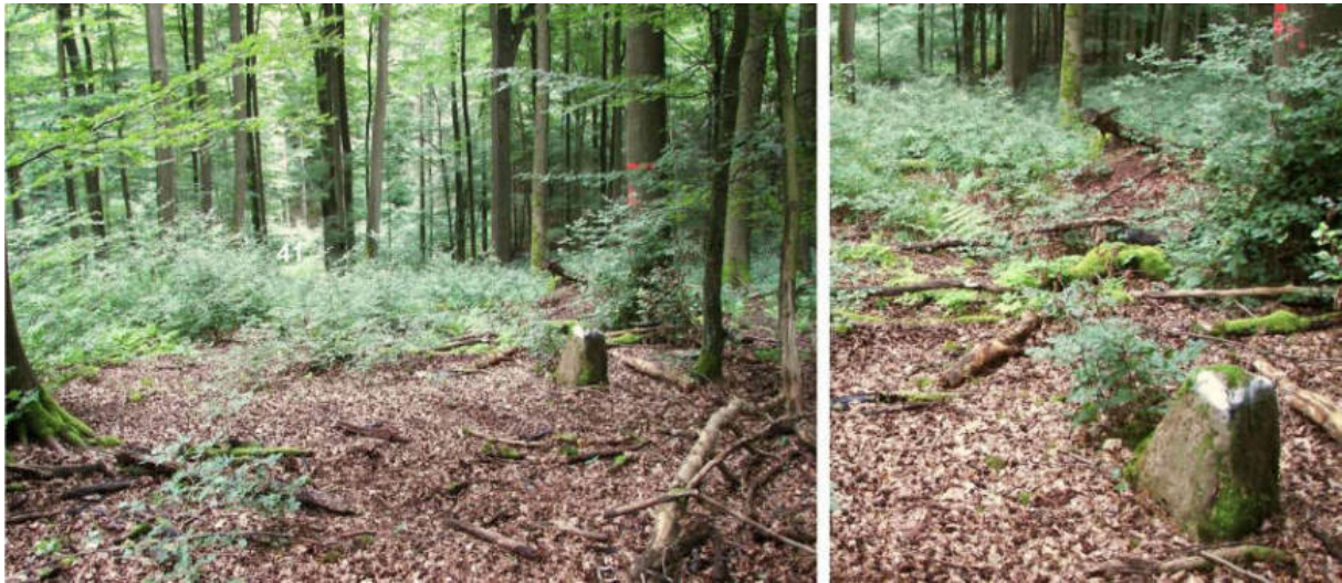
Abb. 53: Grenzstein Nr. 42 (vor 1739) – Standort (von SW)