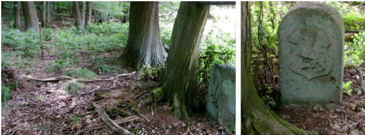
Abb. 103: Grenzstein Nr. 80 (1739) – Standort (von NO zu Nr. 81), Ansicht der H-Seite

Das Sandsteinmaterial des Grenzsteins Nr. 79 – unten rechter Hand am Ortberge und linker Hand am Hanxledischen Driesch – ist auffällig grobporig.