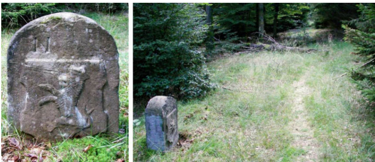
Abb. 67: Grenzstein Nr. 50 (1739) – Ansicht der H-Seite, Standort (von N zu Nr. 51)

Am Standort Nr. 51 steht ein ungezeichneter Ersatzstein, welcher wahrscheinlich, wie Nr. 48 in der zweiten Hälfte des 19. Jahrhunderts gesetzt worden ist.