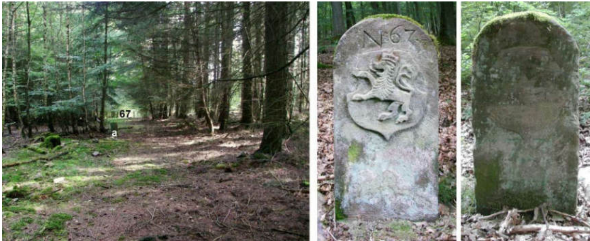
Abb. 86: Grenzstein Nr. 67 (1739) – Standort (von SW), Seitenansichten

An einem jüngeren Forststein vorbei geht es nach Südwesten zum knapp 120 m entfernten Standort Nr. 68, wo in den 1850er Jahren ein in Anlehnung an Typ Gudensberg gestalteter Ersatzstein aufgestellt worden ist.