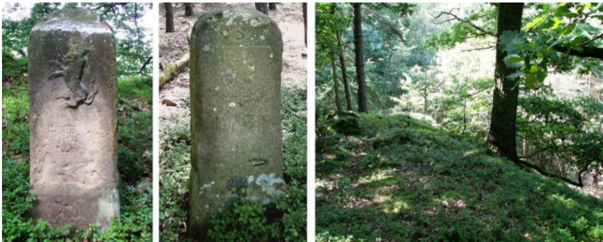
Abb. 78: Grenzstein Nr. 58 (1739) – Seitenansichten, Standort zu Nr. 59 (von N)

Der nicht gefundene Grenzstein Nr. 59 wurde 1740 noch am Hohenstein an der Seite des Berges aufgestellt, er zeigte den Berg herab in die Wiesen-Grund (Braunauer Grund) zu Nro. 60, am Fuß des Berges, unter dem Hohenstein, linker Hand an dem Wasser, so von Braunau herunterkommt (Wälzebach) . Grenzstein Nr. 59 ist zwischen Bach und der heutigen Bundesstraße 485 untergegangen.