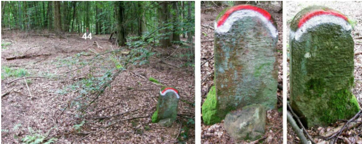
Abb. 57: Grenzstein 44a vom Beginn des 20. JH. – Standort (von W), Seitenansichten

Die Bedeutung des unten abgebildeten Grenzsteins 44a, welcher rd. 20 m westlich von Nr. 44, ohne jegliche Zeichnung, neben dem Stumpf eines älteren Steins, quer zur Grenzlinie steht, bleibt im Unklaren.