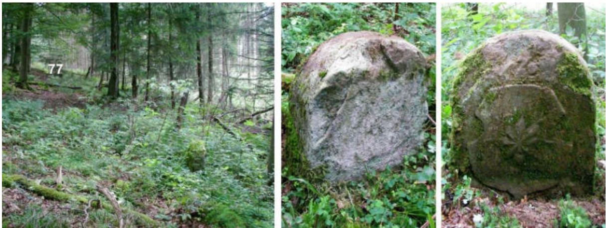
Abb. 98: Grenzstein Nr. 76 (1739) – Standort (von O), Seitenansichten

Die hessische Seite des tief in den Boden gesunkenen Grenzsteins Nr. 76 (1739) ist ganzflächig abgespalten. Ein gleiches Schicksal droht dem 110 m westlich zu findenden Folgestein Nr. 77 (1739).