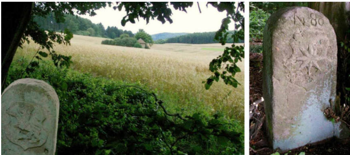
Abb. 104: Grenzstein Nr. 80 (1739) – Standort (von NO), Ansicht der W-Seite