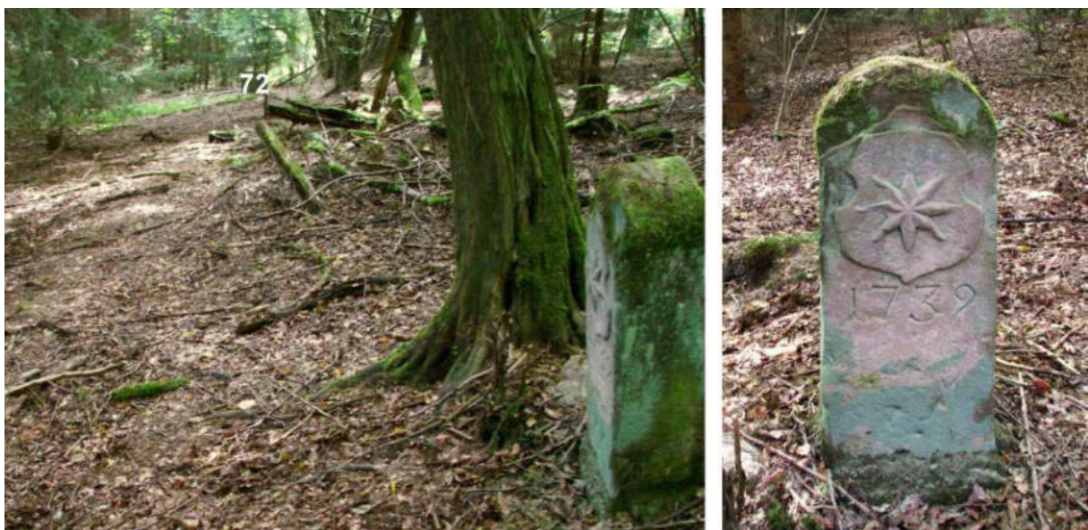
Abb. 93: Grenzstein Nr. 73 (1739) – Standort (von W), Ansicht der W-Seite

Der sehr gut erhaltene Grenzstein Nr. 73 von 1739 steht rd. 100 m westlich am Bergaufstieg an der Nordost-Flanke des Orthbergs.