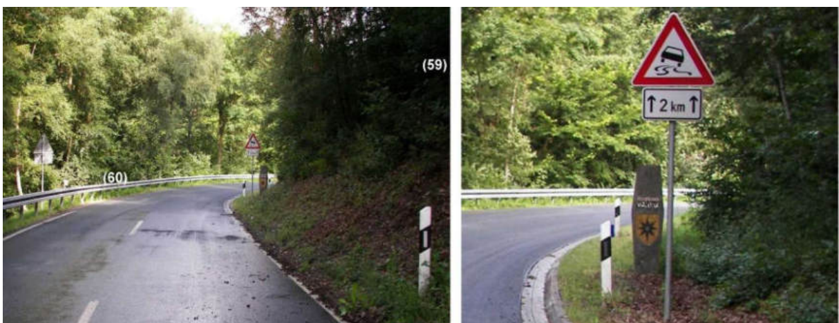
Abb. 79: Grenze im Bereich von Steinstandort Nr. 60 (von SO)

Der nicht gefundene Grenzstein Nr. 59 wurde 1740 noch am Hohenstein an der Seite des Berges aufgestellt, er zeigte den Berg herab in die Wiesen-Grund (Braunauer Grund) zu Nro. 60, am Fuß des Berges, unter dem Hohenstein, linker Hand an dem Wasser, so von Braunau herunterkommt (Wälzebach) . Grenzstein Nr. 59 ist zwischen Bach und der heutigen Bundesstraße 485 untergegangen.