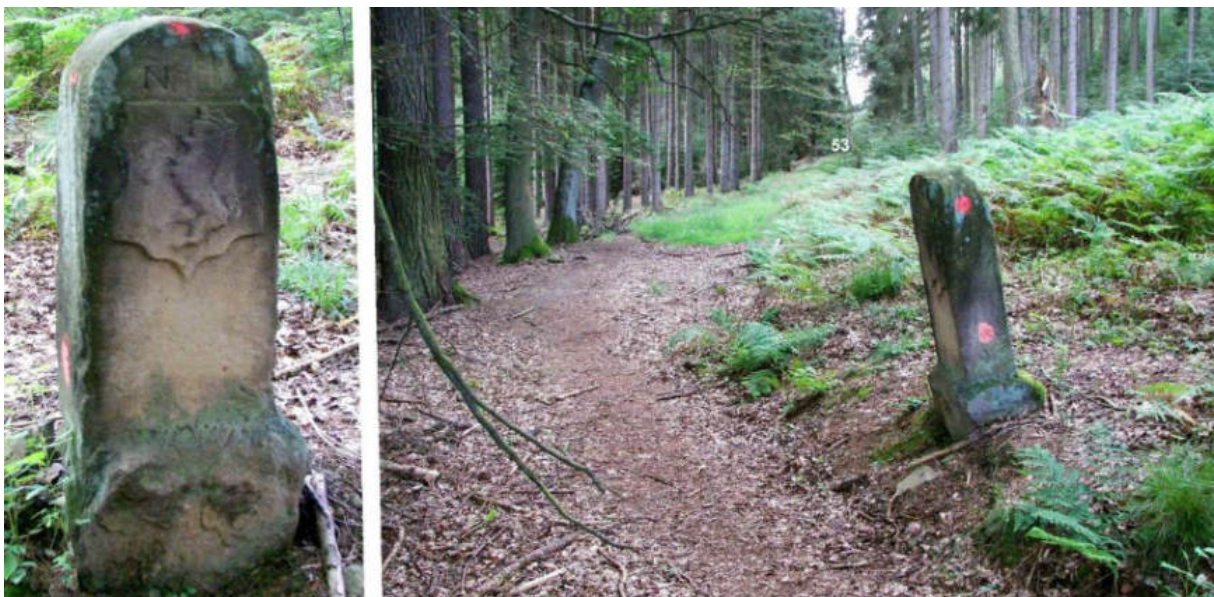
Abb. 70: Grenzstein Nr. 52 (1739) – Ansicht der H-Seite, Standort (von NNO)