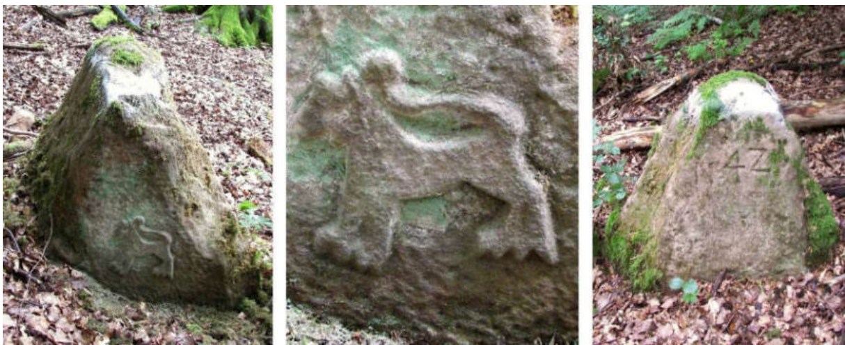
Abb. 54: Grenzstein Nr. 42 (vor 1739) – Seitenansichten

Nr. 42 ist ein alter, hessischer Seits mit einem kleinen Löwen bezeichneter Stein, zeigt linea recta 200 m westsüdwestlich zwischen den Waldungen den Berg hinauf zum sehr gut erhaltenen Stein Nr. 43 von 1739.