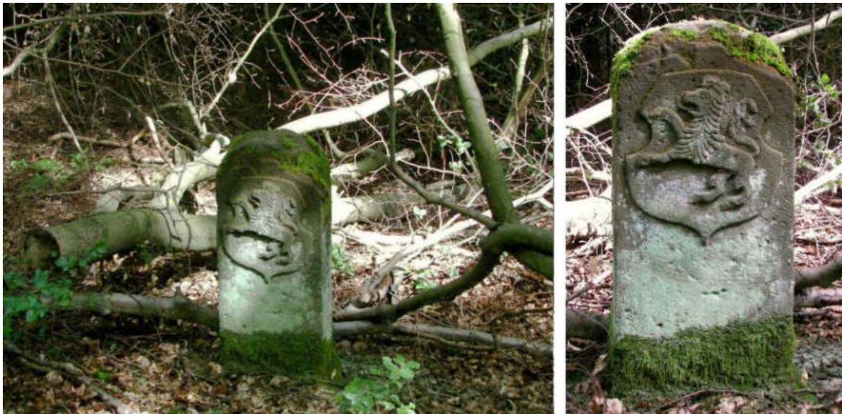
Abb. 95: Grenzstein Nr. 74 (1739) – Standort, Ansicht der H-Seite