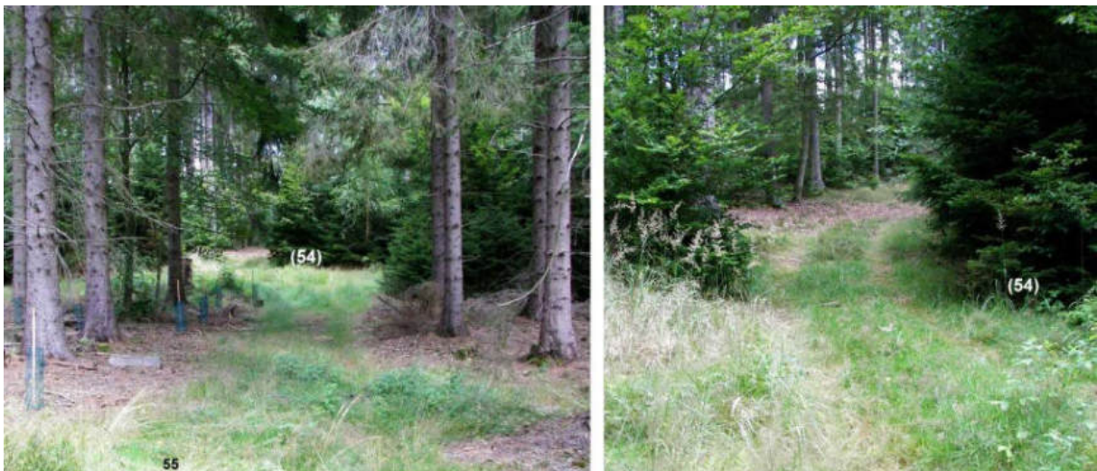
Abb. 72: Grenzsteinstandort Nr. 54 im Grenzverlauf (von S)

Der kaum 30 m südsüdwestlich gesetzte Stein Nr. 54 konnte nicht gefunden werden. Die südwärts folgenden Standorte Nr. 55 und Nr. 56 sind mit Grenzsteinen von 1739 besetzt.