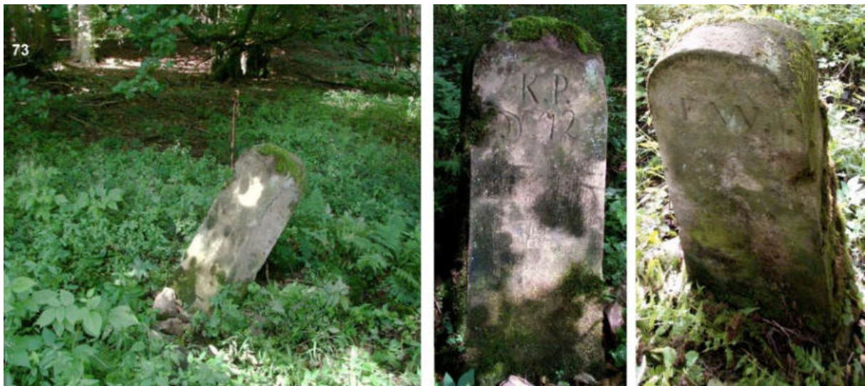
Abb. 92: Grenzstein Nr. 72 (nach 1866) – Standort (von O), Seitenansichten

An die Stelle des alten Steins Nr. 72 ist zu preußischer Zeit, nach 1866, ein Ersatzstein getreten, welcher noch heute, schräg stehend, aber sonst weitgehend unbeschädigt am 1740 festgelegten Standort zu finden ist.