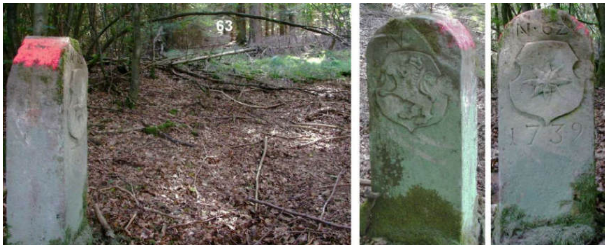
Abb. 81: Grenzstein Nr. 62 (1739) – Standort (von NNO), Seitenansichten

Für alle bis Nr. 72 im Jahr 1740 beschriebenen Grenzsteinstandorte lautete die übergeordnete Lagebezeichnung zwischen dem Adelich-Hanxledischen Söhlen (Gershäuser Gehölz) und der Gemeinde Zwesten Söhlen . Zu bemerken ist ferner, dass die meisten der ab Nr. 63 in diesem Grenzabschnitt noch erfassten 1739er Grenzsteine dem Gestaltungstyp Gudensberg folgen. Nur Nr. 119 und 120 sind dem Typ Borken und Nr. 110 und 117 dem Typ Haina zuzuordnen.