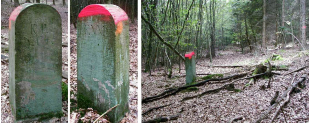
Abb. 83: Grenzstein Nr. 64 (nach 1866) – Seitenansichten, Standort (von NNO)

Der zugesägte Stein Nr. 64 wurde nach 1866, zu preußischer Zeit Hessens, als Ersatzstein aufgestellt. Es sind lediglich die jeweiligen Landesinitialen und einseitig auf preußischer Seite die Nummernzeichnung eingeschlagen.