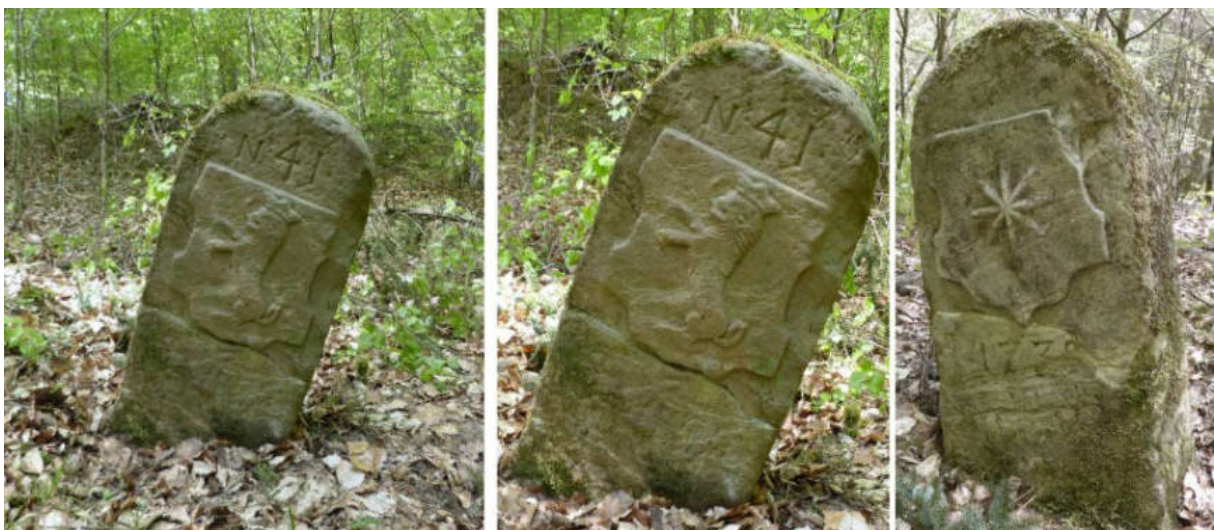
Abb. 52: Grenzstein Nr. 41 (1739) – Seitenansichten