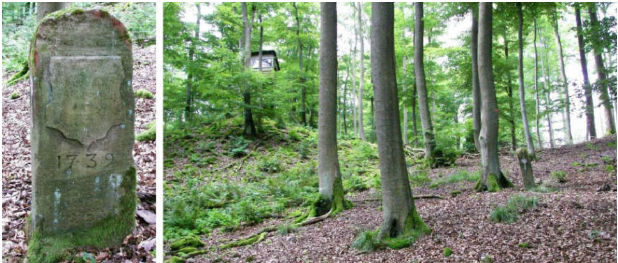
Abb. 62: Grenzstein Nr. 47 (1739) – Ansicht der W-Seite, Standort (von NO zu Nr. 48)

Am Standort Nr. 48 – knapp 100 m südöstlich der Nordkuppe des Lecktopf am Zwestener Buschhorn – liegt ein wohl in der Mitte des 19. Jahrhunderts gesetzter Ersatzstein ohne Zeichnung auf dem Waldboden.