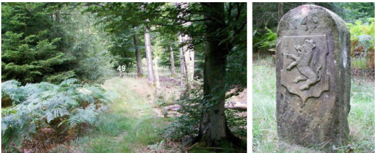
Abb. 64: Grenzstein Nr. 49 (1739) – Standort (von S), Ansicht der H-Seite

Grenzstein Nr. 49 von 1739 steht im Süden der Nordkuppe des Lecktopfs. Von hier geht es am Zwestener Buschhorn und an der Ostflanke der mit knapp 400 m NHN höheren Südkuppe des Lecktopf entlang nach Süden.