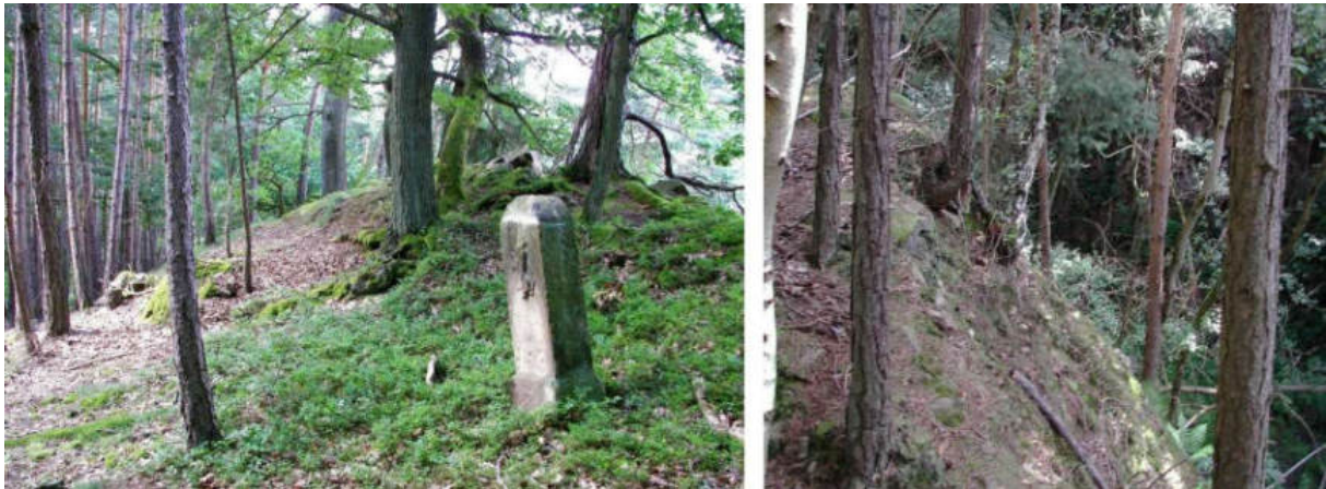
Abb. 77: Grenzstein Nr. 58 (1739) – Standort (von NNO zu Nr. 59)

Der von 1739 erhaltene Landesgrenzstein Nr. 58 (Typ Borken: ohne Wappenschild auf der hessischen Steinseite) wurde oben auf dem Hohenstein (Huhn-Stein), linker Hand der Klippe aufgestellt. Er zeigt über den Rücken der Klippe hinunter zu Nro. 59 .