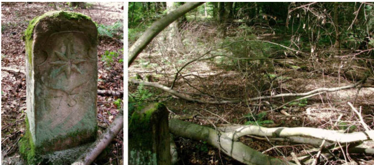
Abb. 96: Grenzstein Nr. 74 (1739) – Ansicht der W-Seite, Standort (von OSO zu Nr. 75)