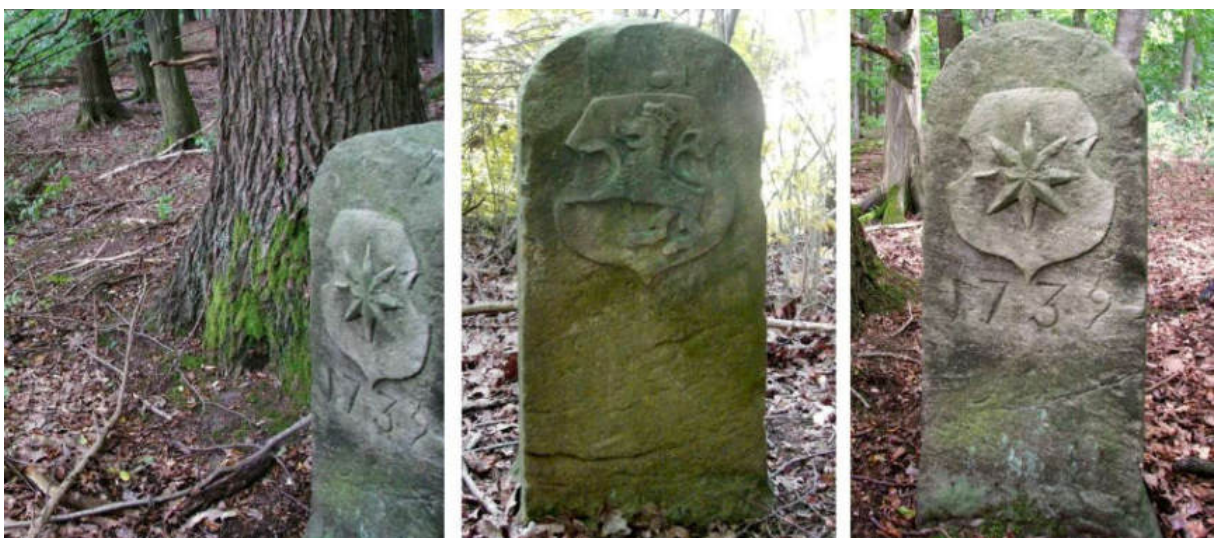
Abb. 105: Grenzstein Nr. 81 (1739) – Standort (von SW), Seitenansichten

Am Standort Nr. 82 – in der Ecke, wo sich linker Hand der Ortberge endigt, und die Hundsgrebe anfängt – ist 1862 ein eng nach dem Vorbild des Typs Gudensberg gefertigter Ersatzstein aufgestellt worden.