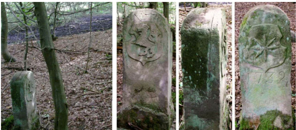
Abb. 99: Grenzstein Nr. 77 (1739) – Standort (von W zu Nr. 76), Seitenansichten