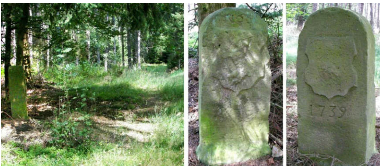
Abb. 73: Grenzstein Nr. 55 (1739) – Standort (von S), Seitenansichten