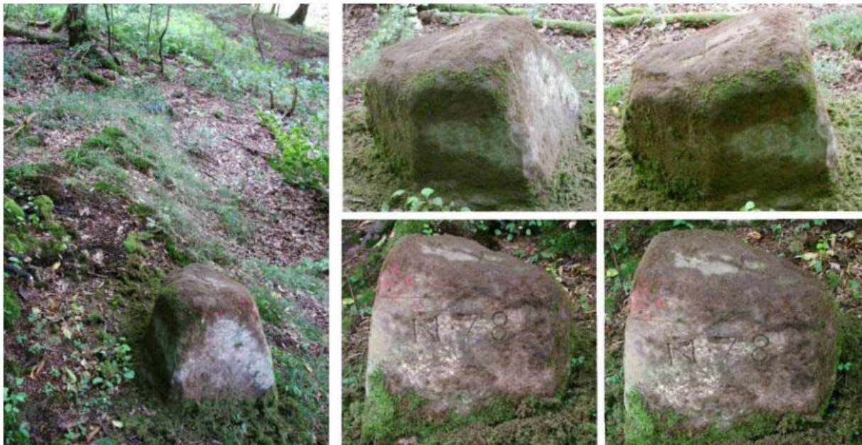
Abb. 101: Grenzstein Nr. 78 (vor 1739) – Standort (von O), Seitenansichten