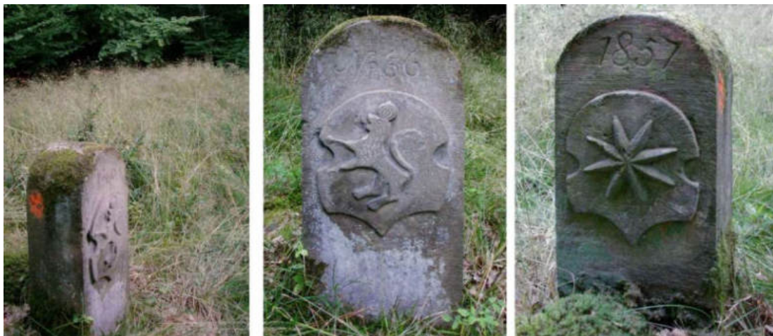
Abb. 85: Grenzstein Nr. 66 (1857) – Standort (von SW), Seitenansichten

Am Standort Nr. 66 wurde 1740 ein vorhandener alter Grenzstein – ohne Wapen und Jahrzahl – in die erneuerte Grenzmarkierung aufgenommen. Im Jahr 1857, zu kurhessischer Zeit, hat man den alten Stein durch den vorgefundenen Ersatzstein ersetzt.