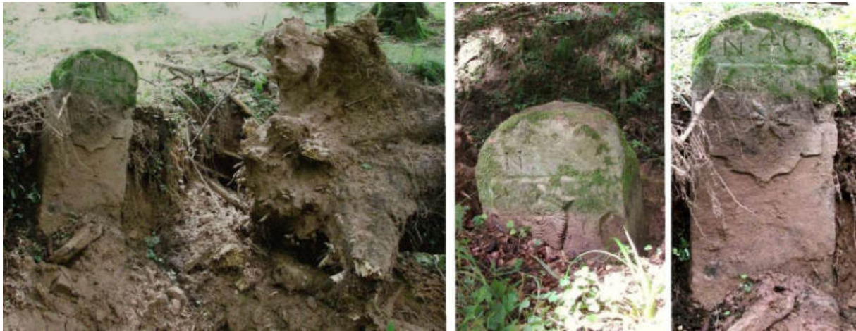
Abb. 50: Grenzstein Nr. 40 (1739) – Standort, Seitenansichten