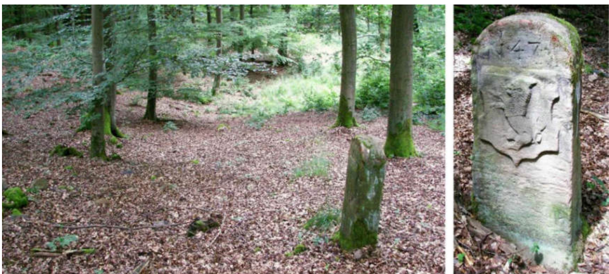
Abb. 61: Grenzstein Nr. 47 (1739) – Standort (von SW zu Nr. 46), Ansicht der H-Seite

An der Südost-Flanke des Braunauer Lecktopf geht es hinauf zum gut erhaltenen Grenzstein Nr. 47 (1739), auf dessen nach Waldeck gerichtetem Wappenschild der Stern fehlt.