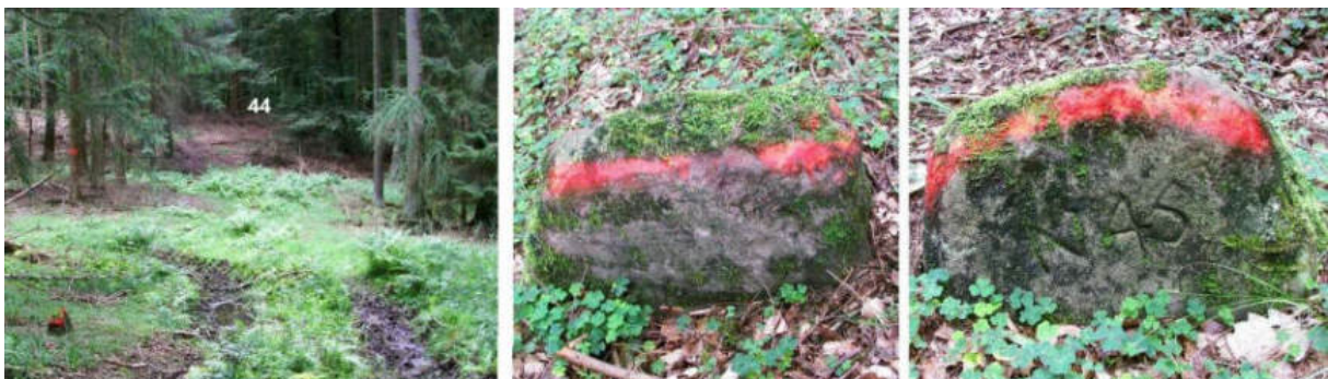
Abb. 58: Grenzstein Nr. 45 (vor 1739) – Standort (von SW), Seitenansichten

Stein Nr. 45 – noch zwischen solchen Waldungen, ist ein alter Stein, ohne Wapen und Jahr Zahl – finden wir tief in den Boden gesunken, knapp 60 m südwestlich von Nr. 44.