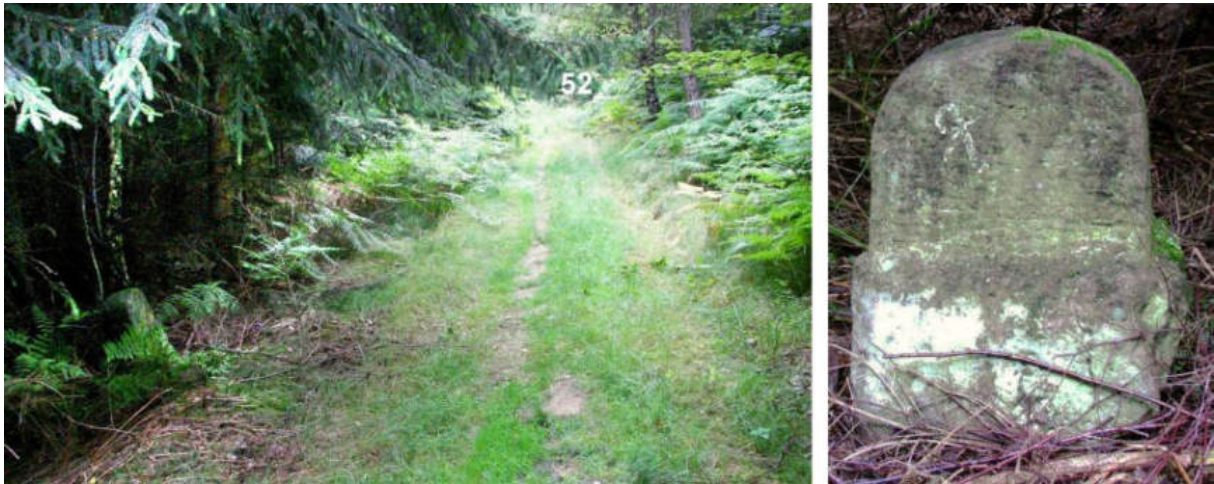
Abb. 68: Grenzstein Nr. 51 (19. Jahrhundert) – Standort (von N), Ansicht der W-Seite Stein Nr. 52 von 1739 steht schräg und hoch, mit aus dem Boden schauender Basiskante, am Grenzwanderweg zwischen den Waldungen des Zwestener und Wildunger Buschhorn .