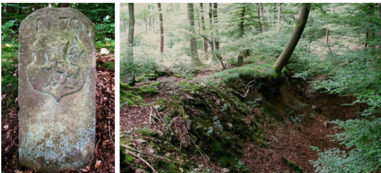
Abb. 91: Grenzstein Nr. 70 (1739) – Ansicht der H-Seite, Standort (von NO)