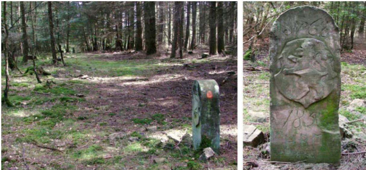
Abb. 87: Grenzstein Nr. 68 (185?) – Standort (von SW), Ansicht der H-Seite

An einem jüngeren Forststein vorbei geht es nach Südwesten zum knapp 120 m entfernten Standort Nr. 68, wo in den 1850er Jahren ein in Anlehnung an Typ Gudensberg gestalteter Ersatzstein aufgestellt worden ist.