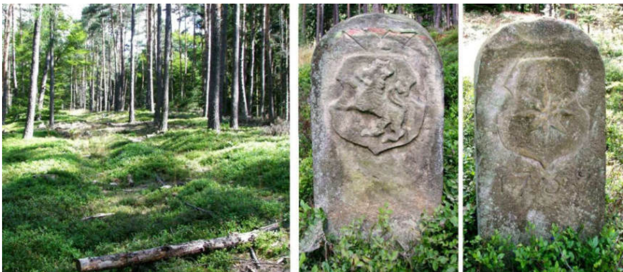
Abb. 76: Grenzstein Nr. 57 (1739) – Standort (von S), Seiten „Typ Gudensberg)

Die Grenzbeschreibung von 1740 benennt für den Standort Nr. 57 nochmals und letztmalig – zwischen den Waldungen des Zwestener und Wildunger Buschhorn . Heute sind „Ottoholz“ und „Am Hohen Steine“ die gebräuchlichen Flurbezeichnungen.