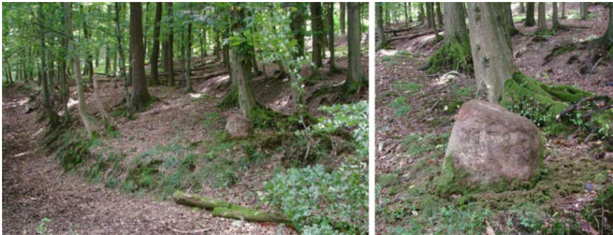
Abb. 100: Grenzstein Nr. 78 (vor 1739) – Standort (von W), Ansicht der W-Seite

Nr. 78 ist ein alter Grenzstein ohne Wappen und Jahreszahl – unten am Ortberge, neben dem Ortberger Wege, über einem Hanxledischen schmalen ausgerotteten Driesch.