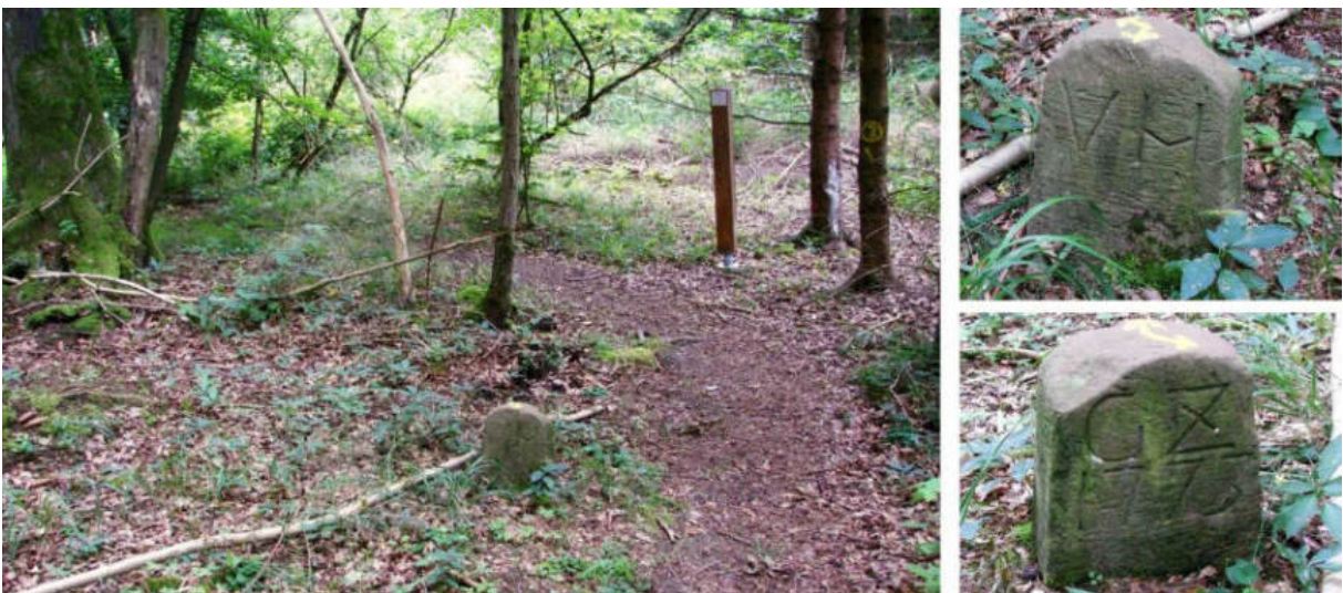
Abb. 108: Grenzstein Nr. 84a VH/GZ (1773) – Standort (von N), Seitenansichten

Der nicht gefundene Grenzstein Nr. 84 stand zwischen der Zwestener Hundsgrebe und dem Hanxledischen Oberfeld. Vielleicht hat man an seinem Standort keinen Ersatzstein gesetzt, weil in unmittelbarer Nähe ein Güterstein „Von Hanxleden / Gemeinde Zwesten“ von 1773 die Grenze hinreichend deutlich markiert.