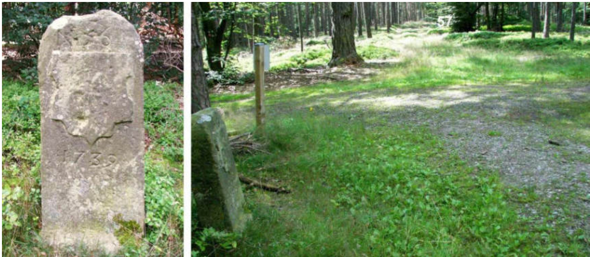
Abb. 75: Grenzstein Nr. 56 (1739) – Ansicht der W-Seite, Standort (von N)

Die Grenzbeschreibung von 1740 benennt für den Standort Nr. 57 nochmals und letztmalig – zwischen den Waldungen des Zwestener und Wildunger Buschhorn . Heute sind „Ottoholz“ und „Am Hohen Steine“ die gebräuchlichen Flurbezeichnungen.