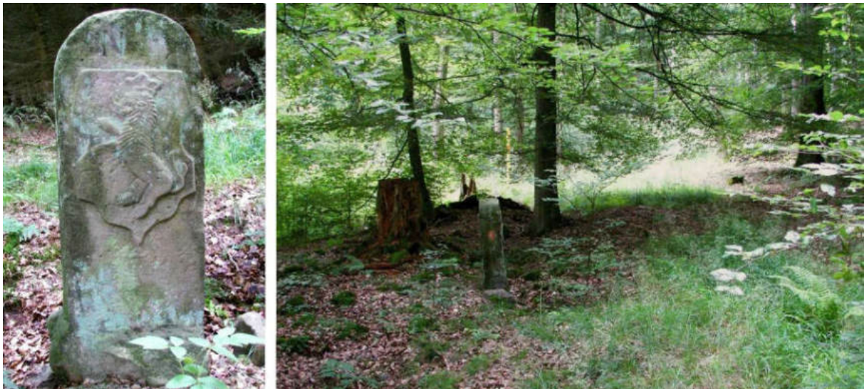
Abb. 60: Grenzstein Nr. 46 (1739) – Ansicht der H-Seite, Standort (von NO zu Nr. 47)

An der Südost-Flanke des Braunauer Lecktopf geht es hinauf zum gut erhaltenen Grenzstein Nr. 47 (1739), auf dessen nach Waldeck gerichtetem Wappenschild der Stern fehlt.