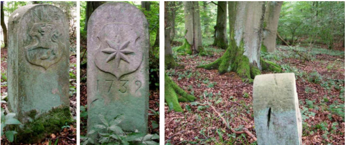
Abb. 107: Grenzstein Nr. 83 (1739) – Seitenansichten, Standort (von NO zu Nr. 84)

Der nicht gefundene Grenzstein Nr. 84 stand zwischen der Zwestener Hundsgrebe und dem Hanxledischen Oberfeld. Vielleicht hat man an seinem Standort keinen Ersatzstein gesetzt, weil in unmittelbarer Nähe ein Güterstein „Von Hanxleden / Gemeinde Zwesten“ von 1773 die Grenze hinreichend deutlich markiert.