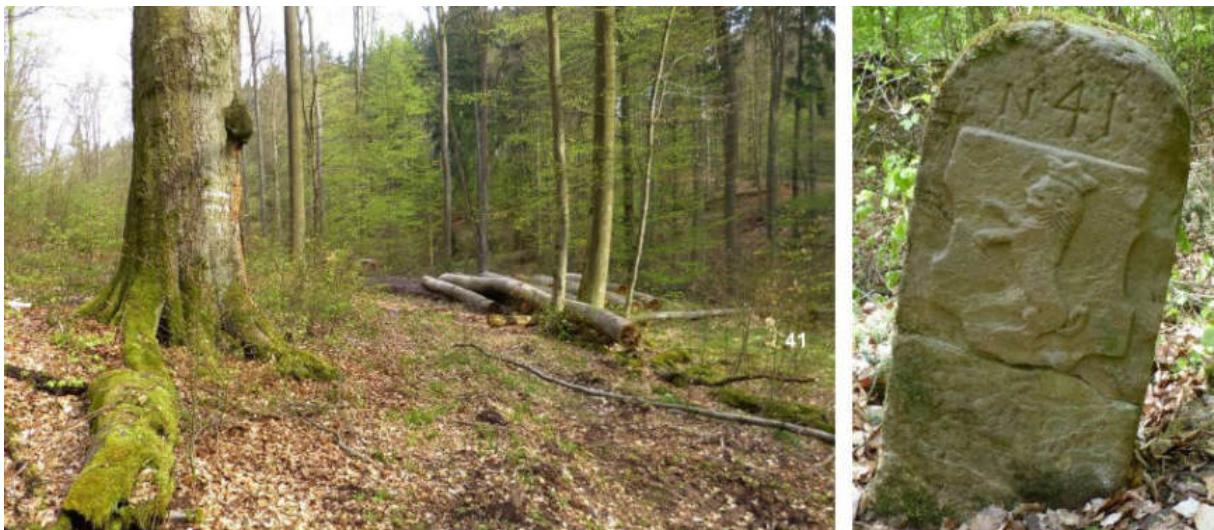
Abb. 51: Grenzstein Nr. 41 (1739) – Standort (von SW), Ansicht der H-Seite