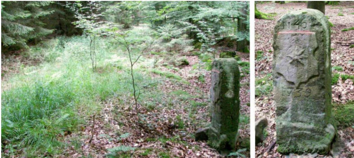
Abb. 59: Grenzstein Nr. 46 (1739) – Standort (von SW zu Nr. 45), Ansicht der W-Seite