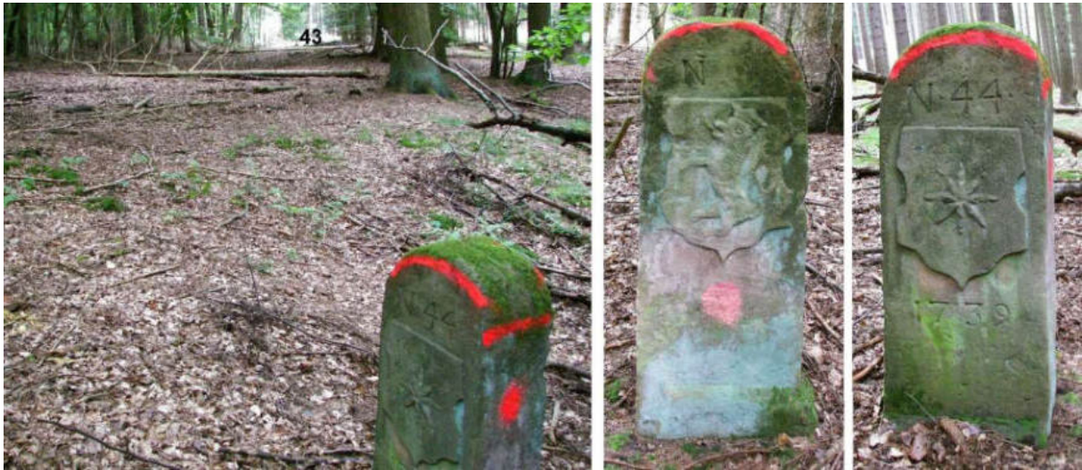
Abb. 56: Grenzstein Nr. 44 (1739) – Standort (von W zu Nr. 43), Seitenansichten

Die Bedeutung des unten abgebildeten Grenzsteins 44a, welcher rd. 20 m westlich von Nr. 44, ohne jegliche Zeichnung, neben dem Stumpf eines älteren Steins, quer zur Grenzlinie steht, bleibt im Unklaren.