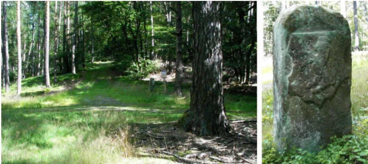
Abb. 74: Grenzstein Nr. 56 (1739) – Standort (von S), Ansicht der H-Seite