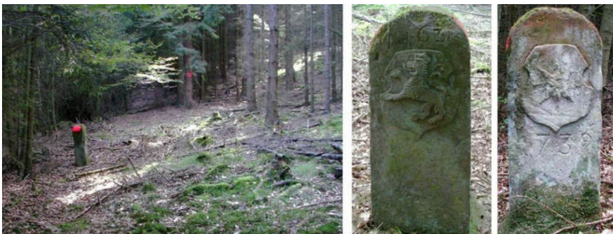
Abb. 82: Grenzstein Nr. 63 (1739) – Standort (von SSW), Seitenansichten