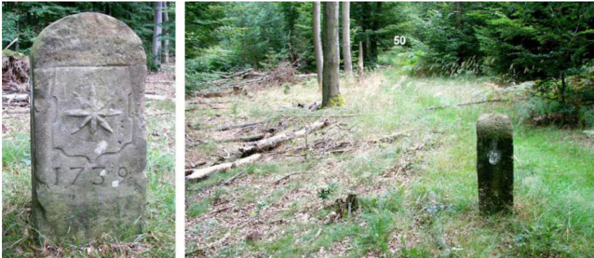
Abb. 65: Grenzstein Nr. 49 (1739) – Ansicht der W-Seite, Standort (von N)

Der gut erhaltene Grenzstein Nr. 50 von 1739 ist tief in den Boden gesunken