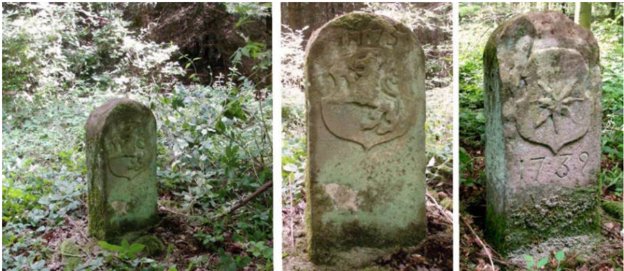
Abb. 97: Grenzstein Nr. 75 (1739) – Standort, Seitenansichten

Grenzstein Nr. 75 steht 110 m westnordwestlich auf der südwestlich gerichteten Linie zwischen Gershäuser Mühle und der Kuppe des Orthbergs.