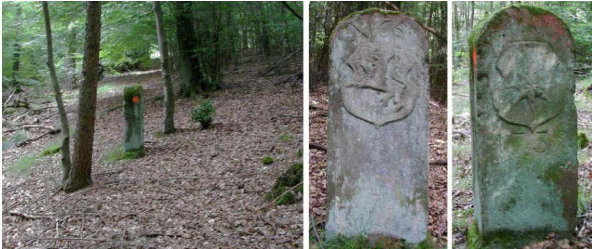
Abb. 84: Grenzstein Nr. 65 (1739) – Standort (von N zu Nr. 66), Seitenansichten

Der zugesägte Stein Nr. 64 wurde nach 1866, zu preußischer Zeit Hessens, als Ersatzstein aufgestellt. Es sind lediglich die jeweiligen Landesinitialen und einseitig auf preußischer Seite die Nummernzeichnung eingeschlagen.