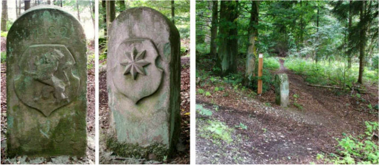
Abb. 106: Grenzstein Nr. 82 (1862) – Seitenansichten, Standort (von SW zu Nr. 83)