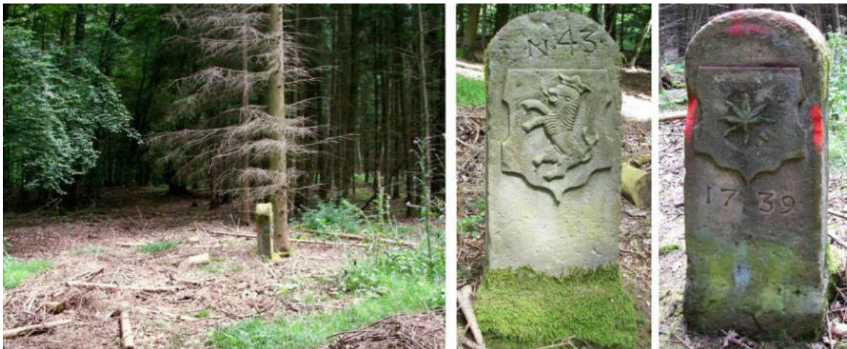
Abb. 55: Grenzstein Nr. 43 (1739) – Standort (von SW zu Nr. 42), Seitenansichten

Nr. 42 ist ein alter, hessischer Seits mit einem kleinen Löwen bezeichneter Stein, zeigt linea recta 200 m westsüdwestlich zwischen den Waldungen den Berg hinauf zum sehr gut erhaltenen Stein Nr. 43 von 1739.