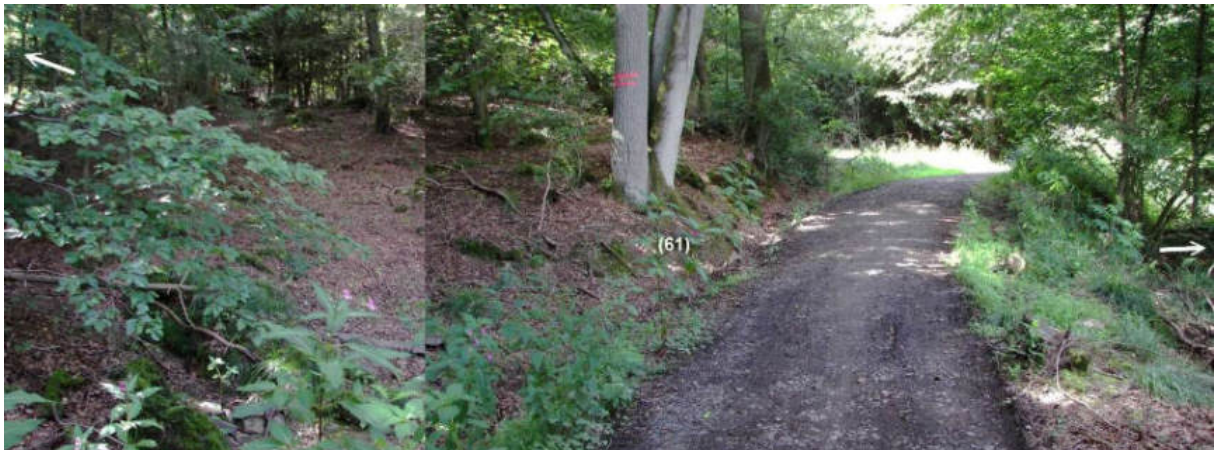
Abb. 80: Grenzsteinstandort Nr. 61 (von SO)

Auch der gut 70 m südwestlich jenseits des Wälzebachs unten zwischen dem Adelich-Hanxledischen Söhlen (Harsch) und der Gemeinde Zwesten Söhlen (Sählen) aufgestellte Grenzstein Nr. 61 konnte nicht mehr gefunden werden.