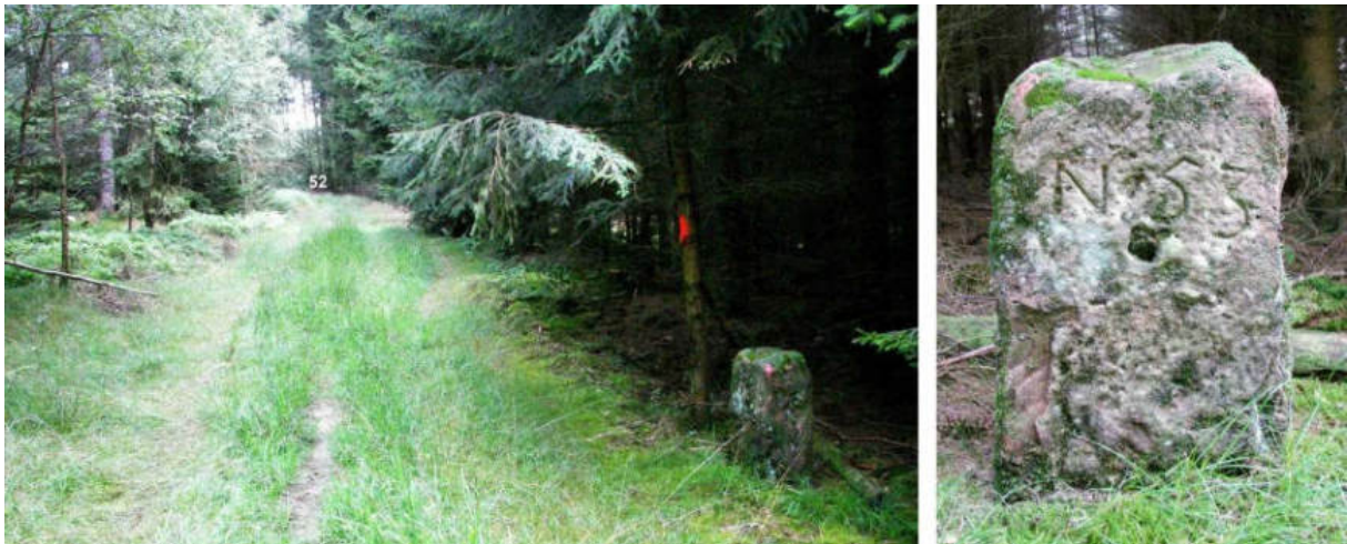
Abb. 71: Grenzstein Nr. 53 (vor 1739) – Standort (von SW), Ansicht der W-Seite

Am Standort Nr. 53 ist 1740 ein alter Stein ohne Wapen und Jahrzahl erhalten geblieben. Auf dessen Waldecker Steinseite wurde 1740 die Nummernzeichnung „N 53“ eingemeißelt.