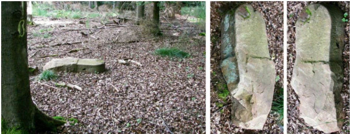
Abb. 63: Grenzstein Nr. 48 (19. Jahrhundert) – Standort (von NO zu Nr. 47), Seitenansichten

Am Standort Nr. 48 – knapp 100 m südöstlich der Nordkuppe des Lecktopf am Zwestener Buschhorn – liegt ein wohl in der Mitte des 19. Jahrhunderts gesetzter Ersatzstein ohne Zeichnung auf dem Waldboden.