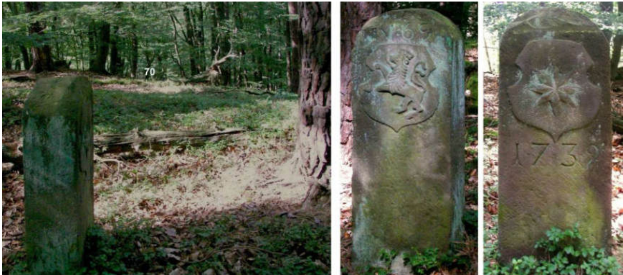
Abb. 89: Grenzstein Nr. 69 (1739) – Standort (von NO), Seitenansichten

Von Grenzstein Nr. 69 auf dem Söhlen-Kopf geht es in südwestliche Richtung 90 m bergab zu Stein Nr. 70 auf einem Sandsteinrücken in ehemaligem Steinbruchgelände.