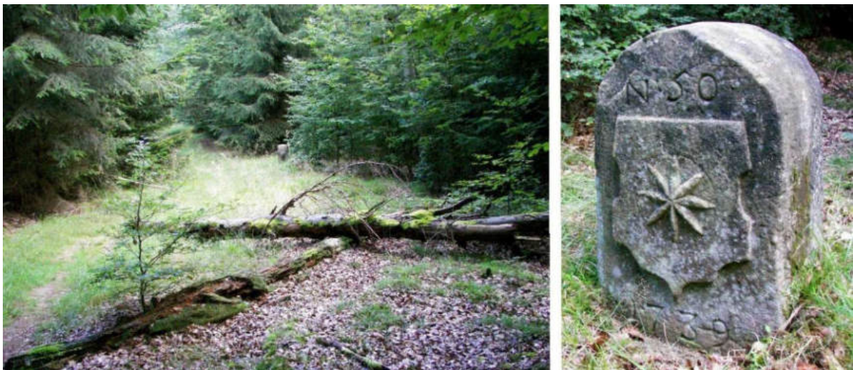
Abb. 66: Grenzstein Nr. 50 (1739) – Standort (von S), Ansicht der W-Seite

Der gut erhaltene Grenzstein Nr. 50 von 1739 ist tief in den Boden gesunken