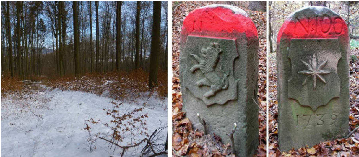
Abb. 134: Grenzstein Nr. 100 (1739) – Grenzgraben (von SW zu Nr.99), Seitenansichten

Von Grenzstein Nr. 99 bis Stein Nr. 104 ist die Grenzlinie durch einen meist noch deutlich erkennbaren Graben markiert. Die Grenzsteinfotos von Nr. 99 (Abb. 133) und Nr. 100 (Abb. 134) offenbaren die Merkmale der Gestaltungstypen Gudensbeg und Borken.