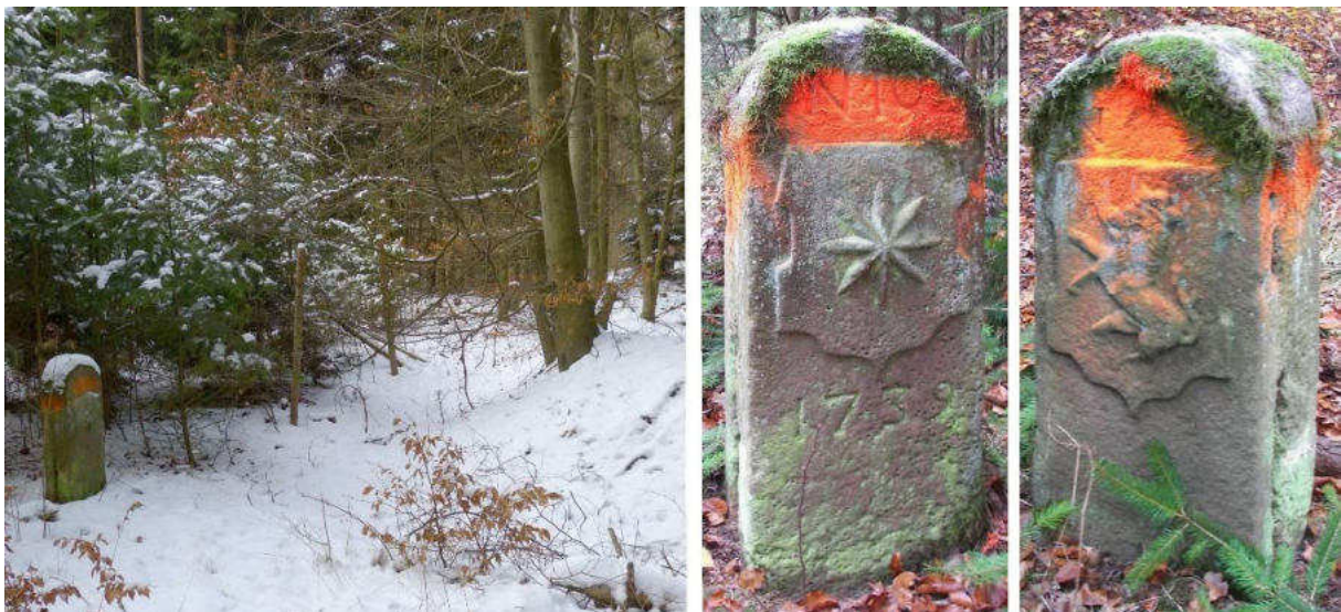
Abb. 137: Grenzstein Nr. 102 (1739) – Standort (von NW), Seitenansichten

Grenzstein Nr. 103 (1739) findet sich kaum 20 m südöstlich von Nr. 102 im Grenzgraben. Knapp 20 m weiter ist der nächste Hutetrift-Grenzstein platziert.