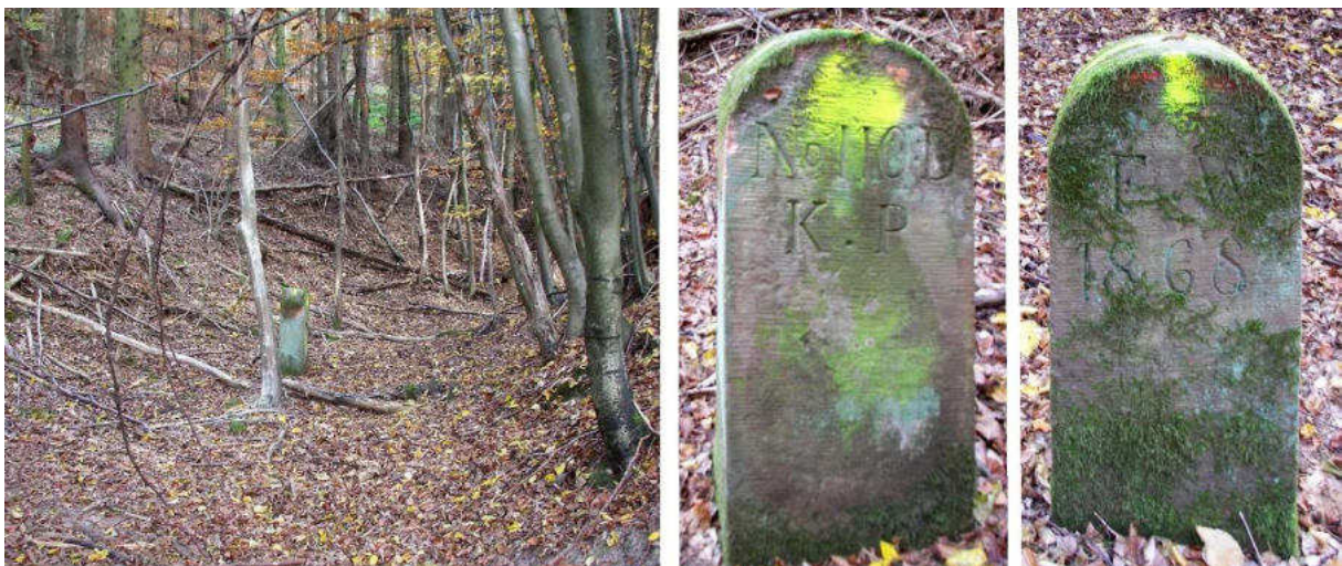
Abb. 154: Grenzstein Nr. 110D (1868) – Standort (von SW), Seitenansichten