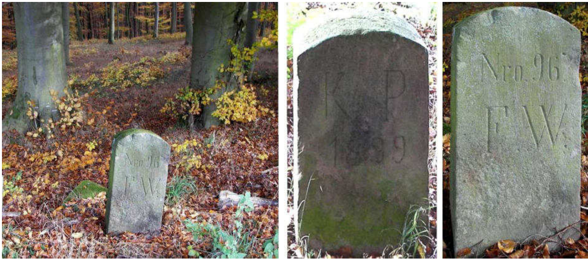
Abb. 129: Grenzstein Nr. 96 (1899) – Standort (von W), Seitenansichten

Es folgt rd. 130 m weiter südwestlich an der nächsten, bis heute erkennbaren, Ecke des Pirsch-Grabens Ersatzstein Nr. 96 von 1899.