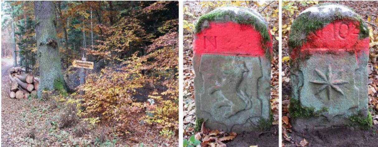
Abb. 139: Grenzstein Nr. 104 (1739) – Standort (von S), Seitenansichten

Am Standort von Grenzstein Nr. 104 weist ein Wanderwegschild zu den Resten der Johanneskirche neugepflanzten Donareiche. Etwa 100 m südsüdöstlich steht an der Ostseite des Waldwegs der letzte Hutetrift-Grenzstein. Die eigentliche Grenzlinie überquert nach Süden gerichtet diagonal den Waldweg zum 115 m entfernten Stein Nr. 105.