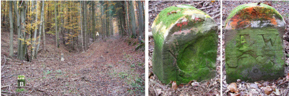
Abb. 152: Grenzstein Nr. 110B (1868) – Standort (von SW), Seitenansichten

Auf Nr. 110A folgt knapp 50 m südwestlich Nr. 110B nach einem Forststein (a) im tiefen Graben.