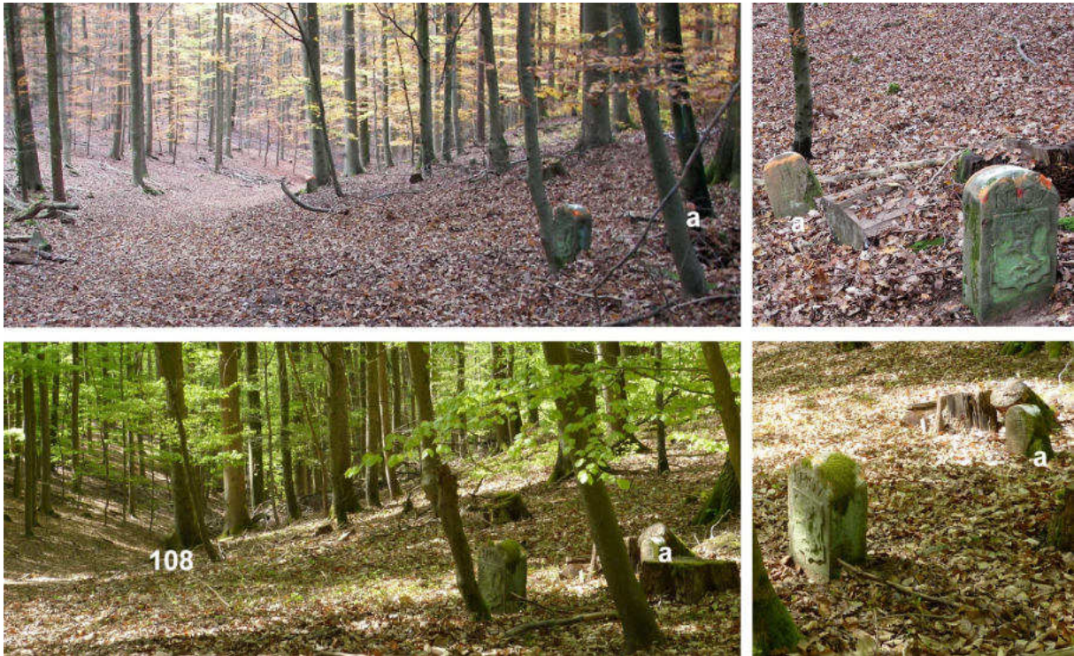
Abb. 144: Grenzstein Nr. 107 mit Meysenbug-Grenzstein (von NO, oben: 2012; unten 2020)