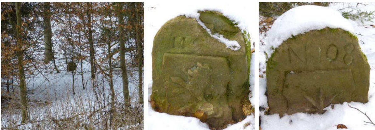
Abb. 146: Grenzstein Nr. 108 (1739) – Ursprünglicher Standort (von O), Seitenansichten