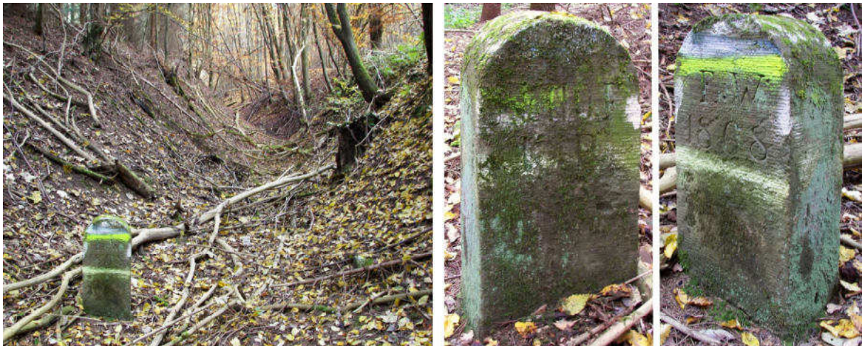
Abb. 155: Grenzstein Nr. 110F (1868) – Standort (von S), Seitenansichten

Von dem ebenfalls noch vorhandenen Grenzstein Nr. 110E (1868) liegt kein geeignetes Foto vor. Auf ihn folgt Nr. 110F rd. 70 m südlich in Riepels Graben.