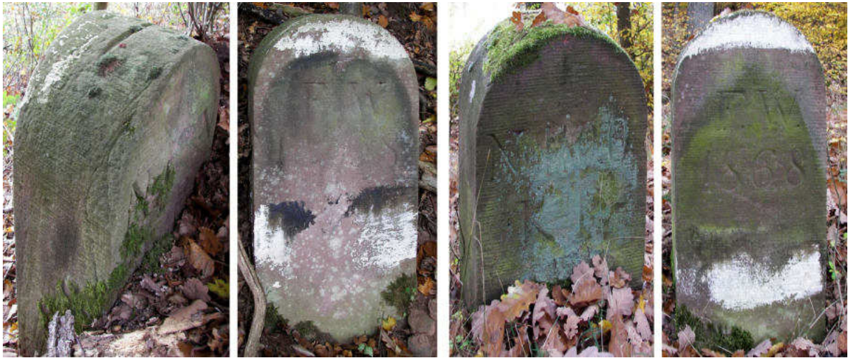
Abb. 161: Grenzsteine Nr. 110N (links) und Nr. 110O (rechts) Seitenansichten

An den etwas nordwestlich des Weges im Wald gelegenen Standorten Nr. 110P und Nr. 110Q konnten keine Grenzsteine gefunden werden.