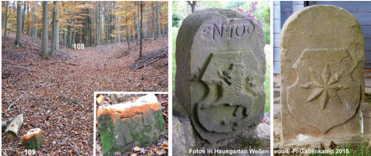
Abb. 149: Grenzstein Nr. 109 (1792) – Standort (von SW), Seitenansichten