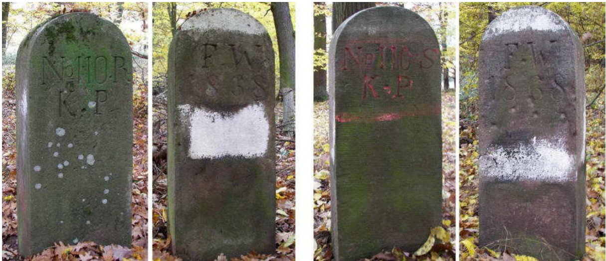
Abb. 162: Grenzsteine Nr. 110R (links) und Nr. 110S (rechts) Seitenansichten

An den etwas nordwestlich des Weges im Wald gelegenen Standorten Nr. 110P und Nr. 110Q konnten keine Grenzsteine gefunden werden.