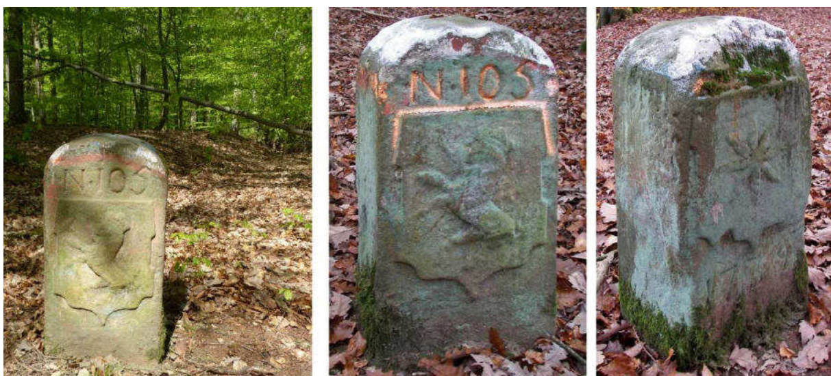
Abb. 141: Grenzstein Nr. 105 (1739) – Standort (von S), Seitenansichten