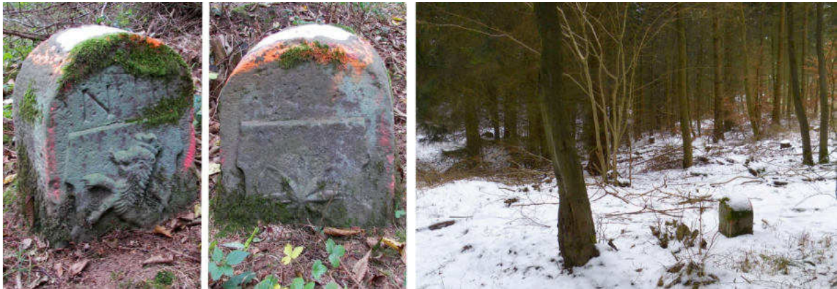
Abb. 168: Grenzstein Nr. 111 (1739) – Seitenansichten, Standort (von NO zu Nr. 112))

Grenzstein Nr. 112 steht knapp 150 m südwestlich – unten an der Ecke des Wellener Ackers, auf einem Rhein, rechter Hand des Schanzen-Grabens, und zeigt linea recta an der jäh en Seite herunter auf Nro. 113.