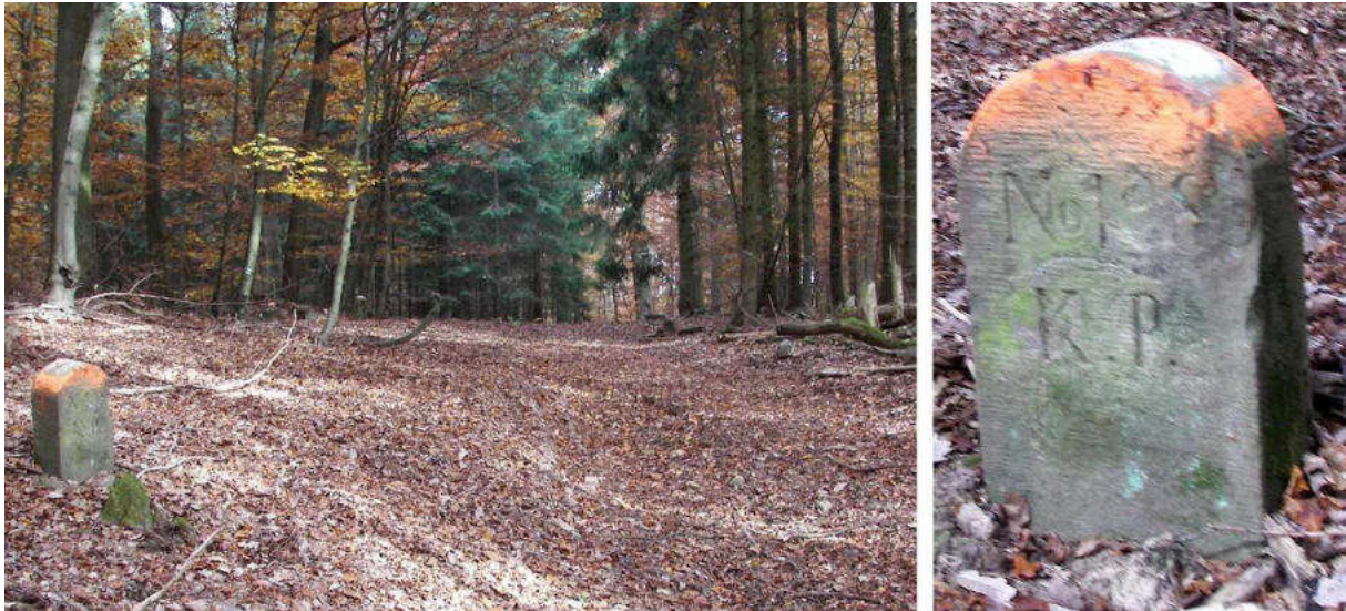
Abb. 147: Grenzstein Nr. 108 (1868) – Standort (von SW zu Nr. 107), Ansicht der KP-Seite