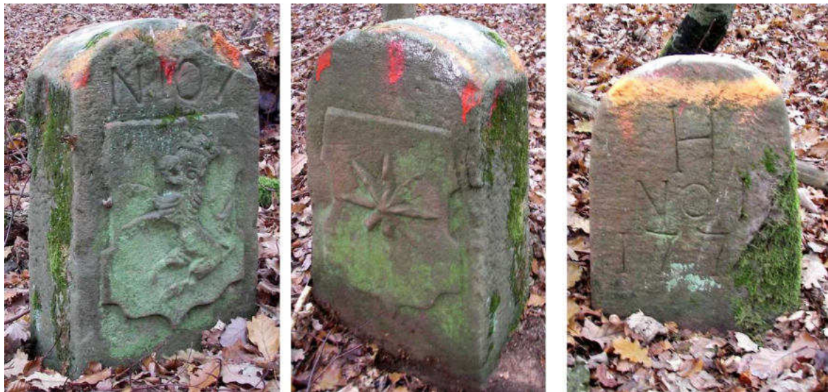
Abb. 145: Grenzstein Nr. 107 (1739) – Seitenansichten; rechts: H-Seite Meysenbug-Stein