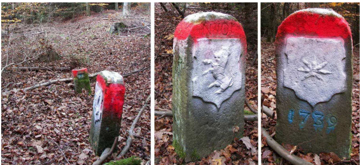
Abb. 135: Grenzstein Nr. 101 (1739) – Standort (von NO zu Nr. 102), Seitenansichten