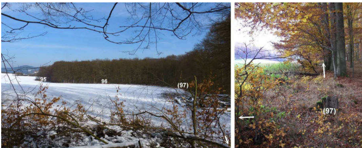
Abb. 131: Grenze im Bereich der Steinstandorte von Nr. 95 zu Nr. 98 (von SW)