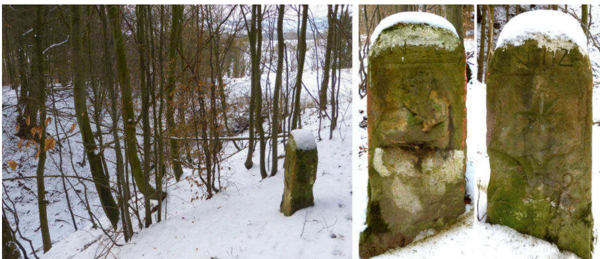
Abb. 169: Grenzstein Nr. 112 (1739) – Standort (von NO zu Nr. 113), Seitenansichten

Grenzstein Nr. 112 steht knapp 150 m südwestlich – unten an der Ecke des Wellener Ackers, auf einem Rhein, rechter Hand des Schanzen-Grabens, und zeigt linea recta an der jäh en Seite herunter auf Nro. 113.