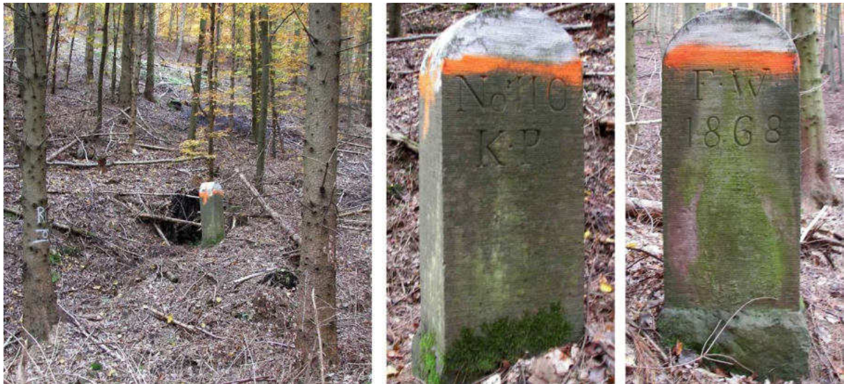
Abb. 150: Grenzstein Nr. 110 (1868) – Standort (von SW), Ansicht der KP-Seite