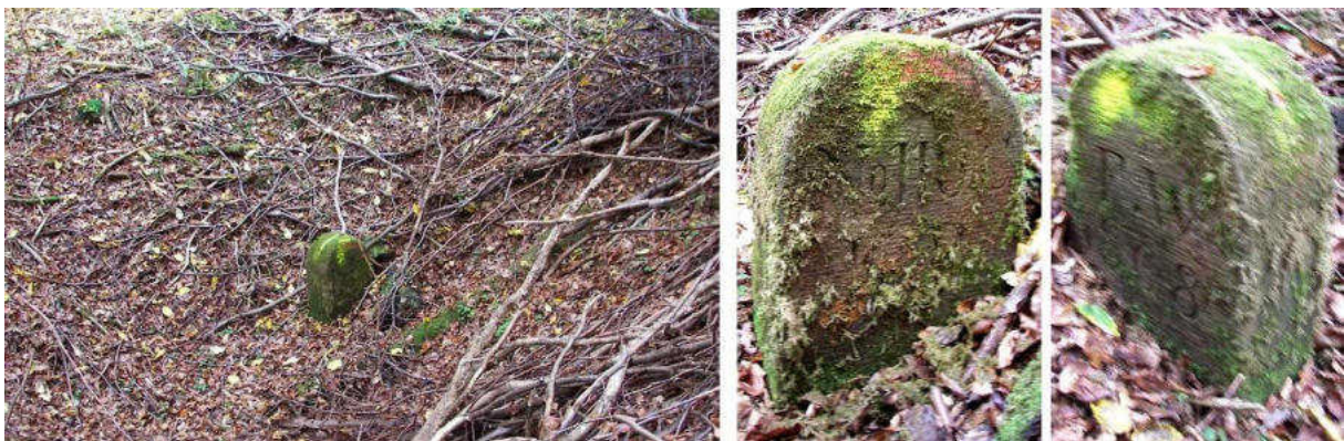
Abb. 153: Grenzstein Nr. 110C (1868) – Standort, Seitenansichten