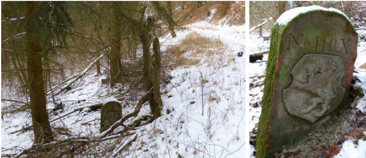
Abb. 165: Grenzstein Nr. 110X (1863) – Standort (von ONO), Ansicht der H-Seite

Am Standort Nr. 110W konnte kein Grenzstein gefunden werden. Standort Nr. 110X ist mit dem 1863 nach dem Vorbild des Typs Gudensberg hergestellten Ersatzstein für Nr. 110 von 1739 besetzt.