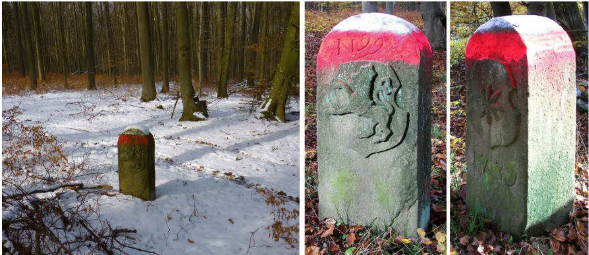
Abb. 133: Grenzstein Nr. 99 (1739) – Standort (von SO), Seitenansichten

Von Grenzstein Nr. 99 bis Stein Nr. 104 ist die Grenzlinie durch einen meist noch deutlich erkennbaren Graben markiert. Die Grenzsteinfotos von Nr. 99 (Abb. 133) und Nr. 100 (Abb. 134) offenbaren die Merkmale der Gestaltungstypen Gudensbeg und Borken.