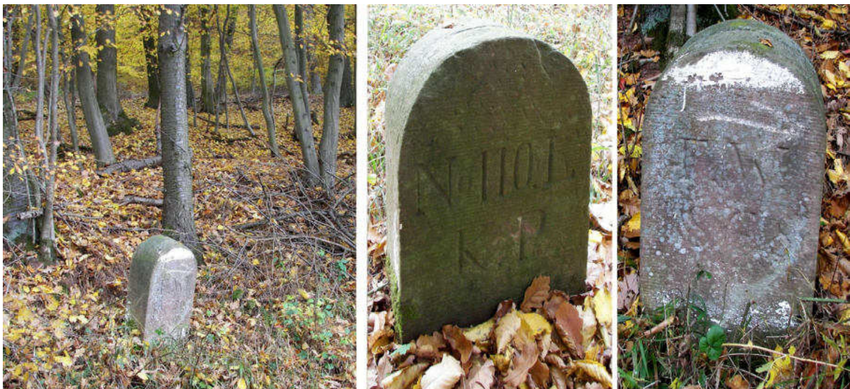
Abb. 159: Grenzstein Nr. 110L (1868) – Standort (von NW), Seitenansichten

Vom Waldrand bei Stein Nr. 110K öffnet sich der Blick über die Haardt-Äcker ins weite Tal der Eder mit den Dörfern Ungedanken, Mandern, Wega und Wellen.