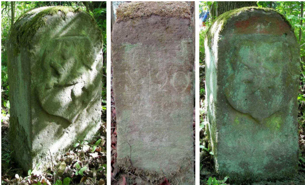
Abb. 173: Grenzstein Nr. 120 (1858) – Seitenansichten

Nr. 120 ist der letzte Grenzstein zwischen dem Amte Gudensberg und Wildungen, steht auf dem Manderschen Rasen, ohnfern der Eder, wo die Feldmarck von Ungedanken anfängt. An der Stelle des Steins von 1739, steht heute ein nach dem Vorbild des Typs Gudensberg angefertigter Ersatzstein, welcher 1858 aufgestellt wurde.