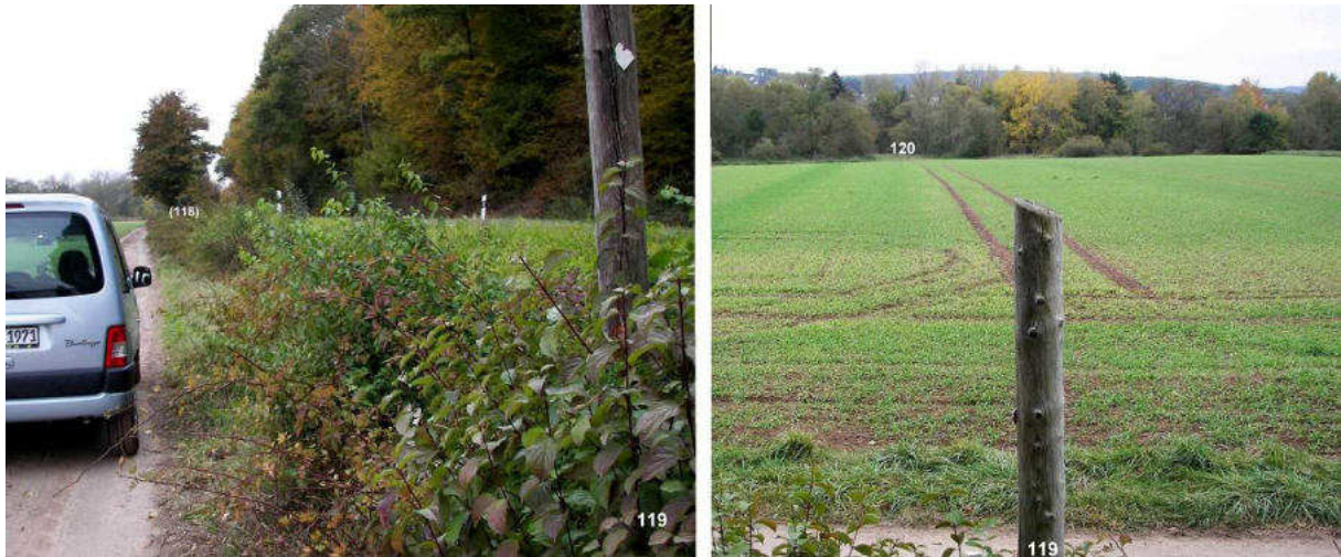
Abb. 172: Grenzstein Nr. 119 (1739) – Standort (links: von OSO, rechts: von N)

Nr. 119 ist ein Eckstein, unter der Wellenharth auf dem Manderschen Rasen auf einem Uffwurff, macht einen Winkel rechter Hand (etwa rechtwinkelig) und zeigt in linea recta an dem Uffwurff über den Rasen fort zu Nro. 120 (rd. 220 m südlich).