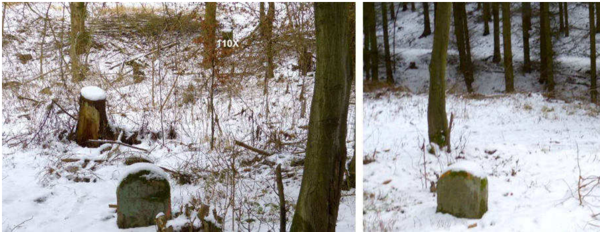
Abb. 167: Grenzsteinstandort Nr. 111 – (links: von SO, rechts: von N am Schanzengraben)

Der gut 15 m südöstlich erhaltene Grenzstein Nr. 111 von 1739 und die darauf bis zum Endpunkt im Grenzabschnitt Gudensberg folgende Grenzlinie blieb von 1739 bis heute unverändert. Zum Standort von Nr. 111 hieß es, steht am Waldrand, vor Johann Ernst von Welle Acker, der Linsen-Acker genannt, wo linker Hand der Schanzen-Graben anfängt, zeigt in linea recta an solchem Acker und Schanzen-Graben hinunter zu Nro. 112.