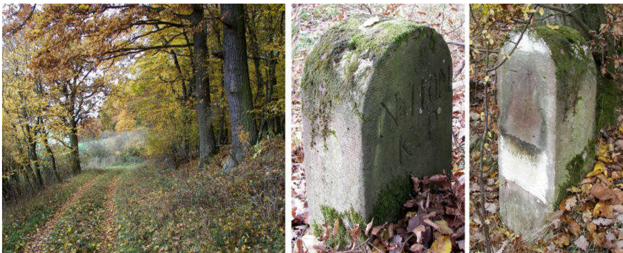
Abb. 160: Grenzstein Nr. 110M (1868) – Standort (von SO), Seitenansichten