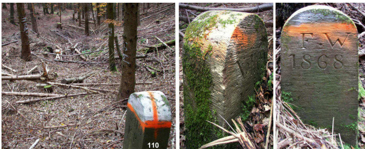
Abb. 151: Grenzstein Nr. 110A (1868) – Standort (von NO), Seitenansichten