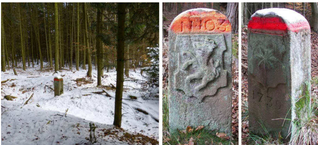
Abb. 138: Grenzstein Nr. 103 (1739) – Standort im Grenzgraben (von W), Seitenansichten

Grenzstein Nr. 103 (1739) findet sich kaum 20 m südöstlich von Nr. 102 im Grenzgraben. Knapp 20 m weiter ist der nächste Hutetrift-Grenzstein platziert.