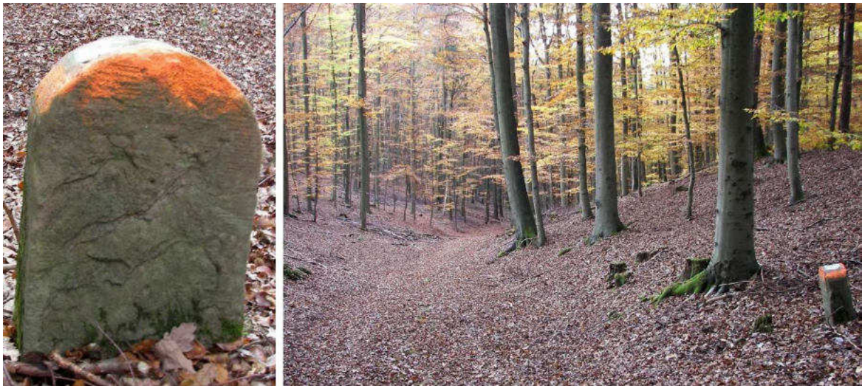
Abb. 148: Grenzstein Nr. 108 (1868) – Ansicht der FW-Seite, Standort (von NO zu Nr. 109)