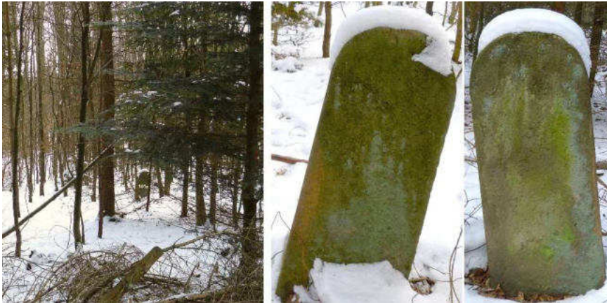
Abb. 136: Hutetrift-Grenzstein 101a – Standort (von N), Seitenansichten

Knapp 20 m südlich von Nr. 101 haben wir zufällig den ersten ungezeichneten Hutetrift-Grenzstein vom Ende des 19. Jahrhunderts entdeckt.