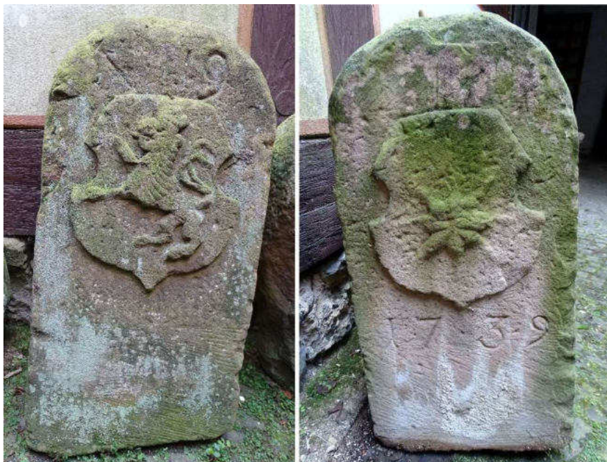
Abb. 171: Grenzstein Nr. 119 (1739) – Seitenansichten