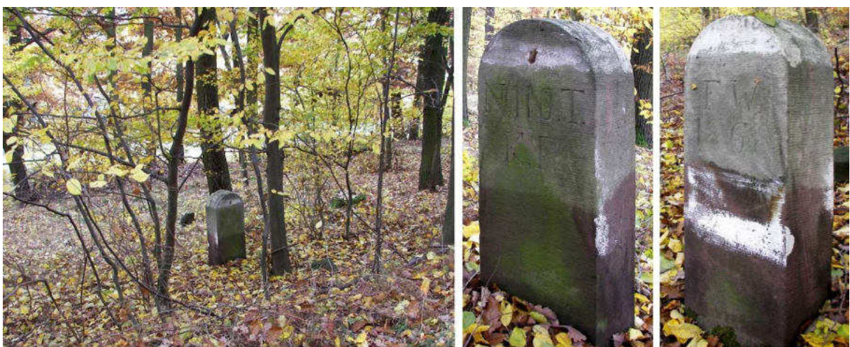
Abb. 163: Grenzstein Nr. 110T (1868) – Standort (von NO), Seitenansichten