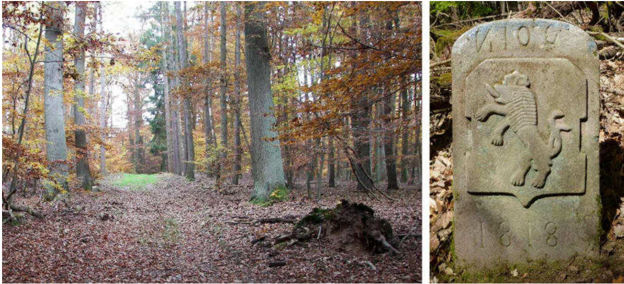
Abb. 142: Grenzstein Nr. 106 (1818) – Standort (von SW), Ansicht der H-Seite

Von Grenzstein Nr. 105 zieht die Grenze südwestlich gerichtet allmählich aus einer flachen Mulde in einen tiefen Taleinschnitt zwischen dem Züscherer Kleinen Steinberg und dem an Geismar gefallenem Großen Steinberg bis zu Grenzstein Nr. 110G, an dem in Riepels Graben auf der waldeckischen Grenzseite die Gemarkung Wellen ansetzt.