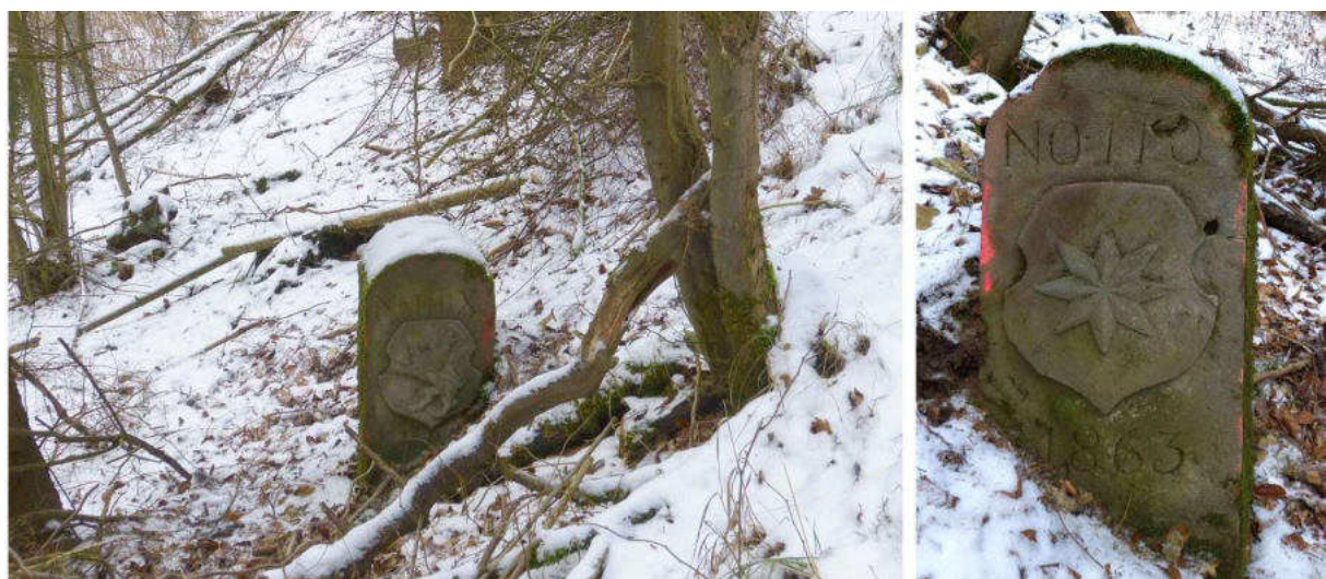
Abb. 166: Grenzstein Nr. 110X (1863) – Standort (von ONO), Ansicht der W-Seite