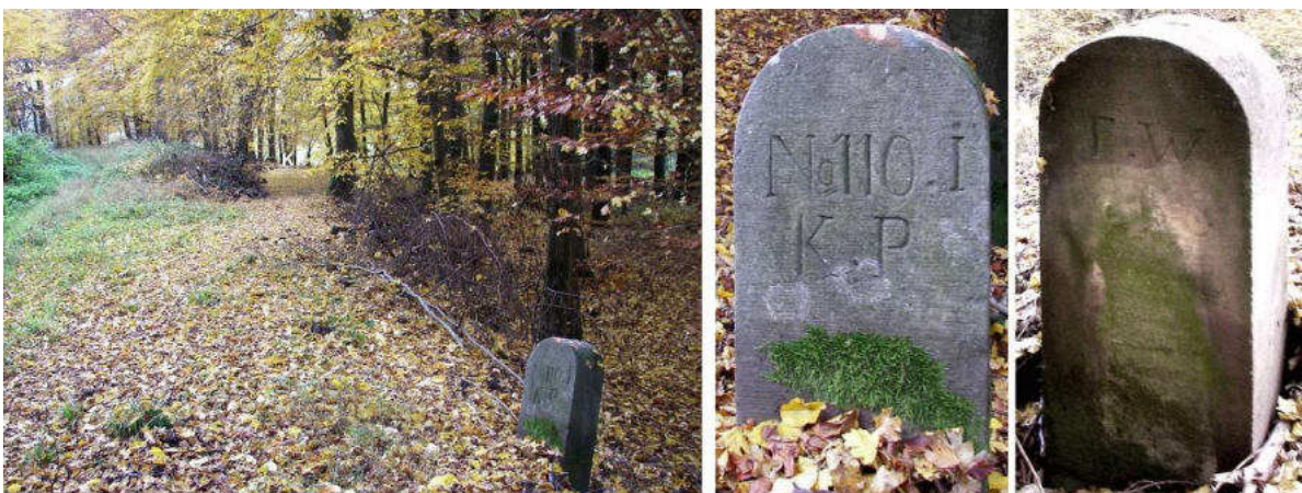
Abb. 157: Grenzstein Nr. 110I (1868) – Standort (von N zu Nr. 110K, Seitenansichten

Auf den nicht gefundenen Stein Nr. 110H folgt bald der gut erhaltene Grenzstein Nr. 110I.