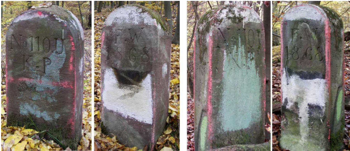
Abb. 164: Grenzsteine Nr. 110U (links) und Nr. 110V (rechts) Seitenansichten

Am Standort Nr. 110W konnte kein Grenzstein gefunden werden. Standort Nr. 110X ist mit dem 1863 nach dem Vorbild des Typs Gudensberg hergestellten Ersatzstein für Nr. 110 von 1739 besetzt.