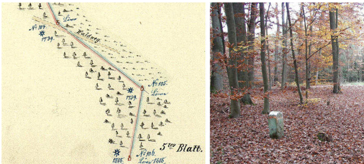
Abb. 140: Grenzkarte von 1868, rechts: Standort Nr. 105 (von SW)