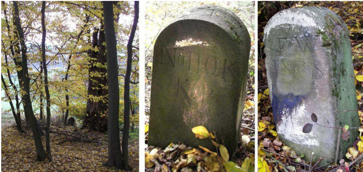
Abb. 158: Grenzstein Nr. 110K (1868) – Standort (von N), Seitenansichten

Vom Waldrand bei Stein Nr. 110K öffnet sich der Blick über die Haardt-Äcker ins weite Tal der Eder mit den Dörfern Ungedanken, Mandern, Wega und Wellen.