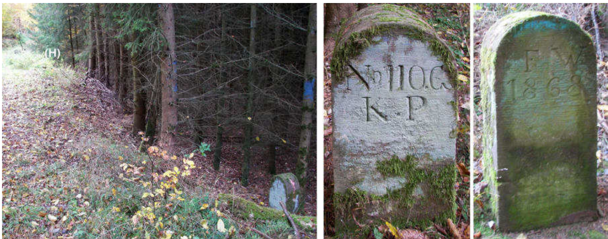
Abb. 156: Grenzstein Nr. 110G (1868) – Standort (von N), Seitenansichten

Am Standort Nr. 110F endet auf waldeckischer Seite die Gemarkung Züschen und die Gemarkung Wellen setzt an. Die Grenzlinie springt knapp 20 m ostwärts aus dem Graben zu Stein Nr. 110G an der Westseite eines Waldweges, mit dem sie 150 m südlich aus dem Wald am Steinberg heraustritt und dann ein Stück am Waldrand zu Nr. 110O nach Südosten läuft.