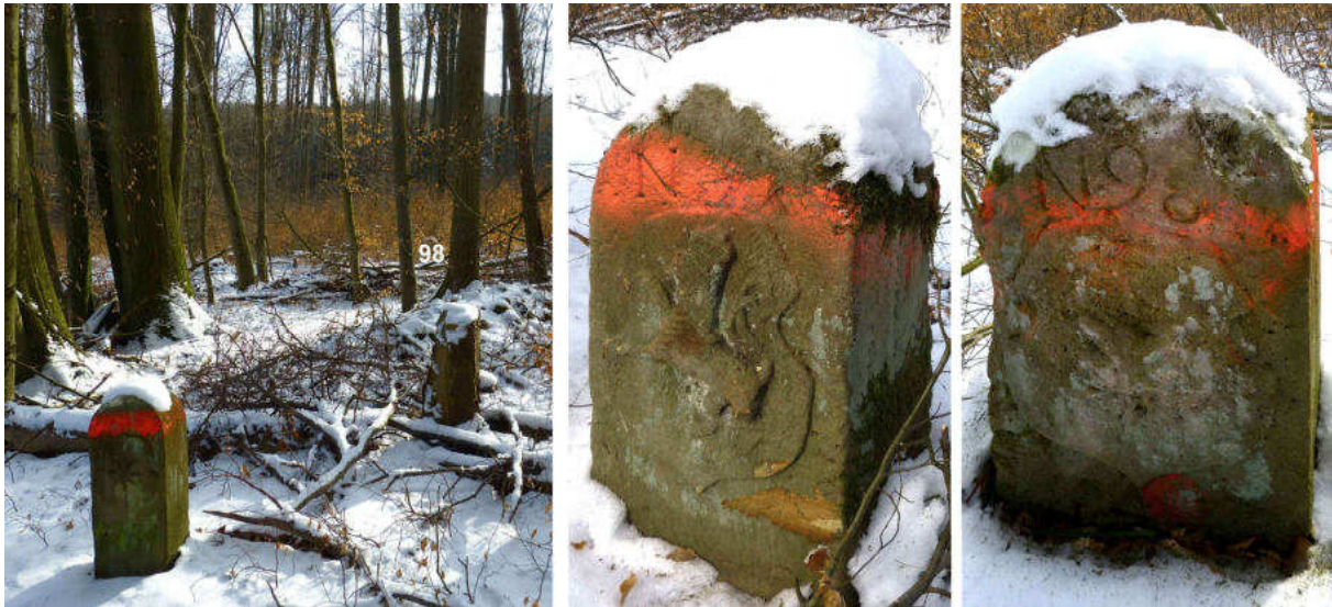
Abb. 132: Grenzstein Nr. 98 (1739) – Standort (von NW), Seitenansichten

Nach dem Grenzvertrag von 1867 wurde die Grenzlinie zwischen den Standorten Nr. 97 und Nr. 110 nach Nordwesten auf ehemals waldeckisches Gebiet verschoben. Die Grenzlinie von 1739 war in diesem Bereich aus der Westgrenze des vormals umfangreichen Meysenbugischen Waldbesitzes südlich vom Johanneskirchenkopf um Strombusch und Steinberg abgeleitet. Nach dem Aussterben derer von Meysenbug 2 im Jahr 1810 hatten die Erben den Besitz verkauft, und der oben benannte Waldkomplex war in den Besitz der hessischen Gemeinde Geismar gelangt. Mit der Grenzänderung kam der erheblich vergrößerte Waldbesitz der nun preußischen Gemeinde Geismar folgerichtig unter preußische Hoheit.